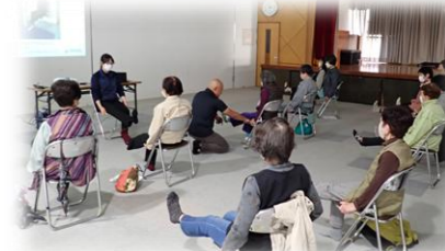
＜家族介護教室：生石＞