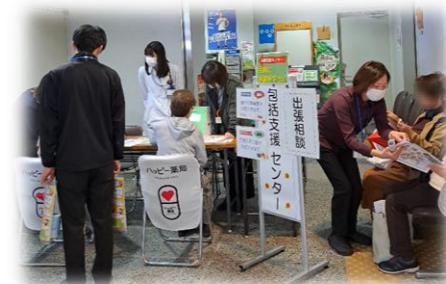
＜味生地区総合文化祭にて＞