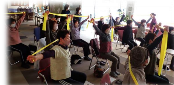
＜健康講座：老人保健施設ミネル7＞