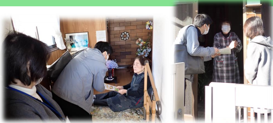
↑ 自宅を訪問し、説明する様子

県内の特殊詐欺が急増し、被害件数は前年比で約2倍となり、被害者の約6割は60歳以上と、 高齢者の被害が深刻 になっています。 包括支援センターでは、年末の12月から1月にかけて、民生委員さんと協働で独居高齢者へ、詐欺被害の予防方法や相談窓口を掲載したリーフレットを配布し注意喚起をしました。