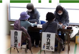
＜出張相談会：北吉田分館＞