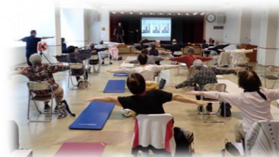
＜家族介護教室：味生＞