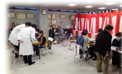
＜生石地区文化芸能祭にて＞