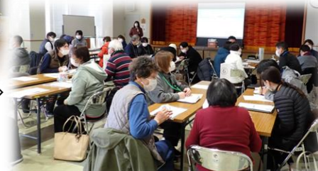
＜認知症ケア向上合同研修会：味生＞