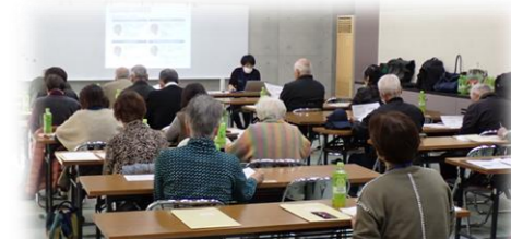
＜認知症サポーター養成講座：生石＞