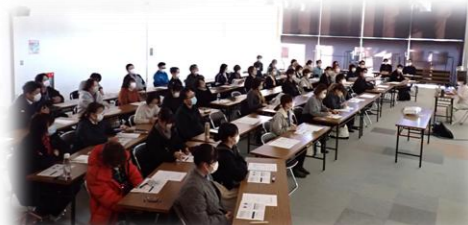
＜介護サービス事業所連絡会＞