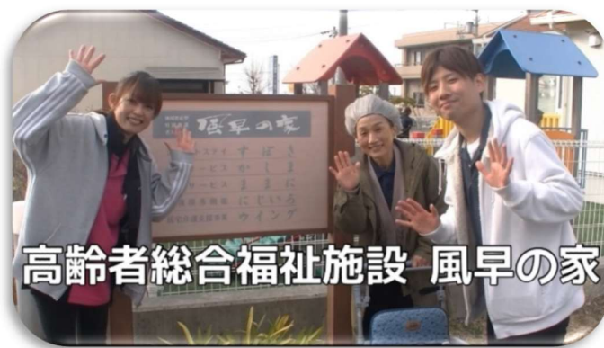
高齢者総合福祉施設 風早の家