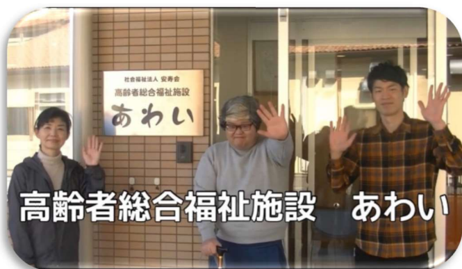
高齢者総合福祉施設 あわい