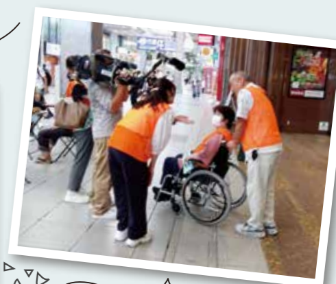
テレビ取材もありました!