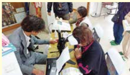
▲ハッピー薬局による骨量測定、認知機能測定

11月2日垣生公民館で地区文化祭が開催され大勢の方で賑わいました。地域包括支援センター垣生・余土も、地区薬局と協働して「出張相談&健康チェック」を開催しました。皆様健康意識が高く、骨量計・認知機能測定器に興味津々!測定後は専門職から食事の工夫や運動について助言もあり、今後の目標ができたのではないのでしょうか。会場には手作りの作品や習字などが展示され、皆様作品を熱心に観賞していました。小さな子供さんが「ねーねーボクのこれだよ!」と教えてくれ、その誇らしげな笑顔にとっても癒やされました。これからも地域に出かけ地域を知り、たくさん笑顔と出会いたいと感じました。(浮田)