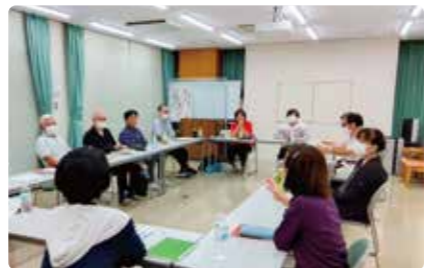
◀つどいの様子。一人ひとりの言葉に耳を傾ける時間

“認知症になったとしても、介護する側になったとしても、人としての尊厳が守られ日々の暮らしが安穩に続けられなければならない（～「家族の会」理念より～）”という理念のもと、1980年発足後、全国47都道府県の支部に約1万人の会員が活動しています。松山市でも毎月1回、交流会「つどい」が開かれており、認知症本人や家族同士が日頃の話題をあれこれ話し合ったり、医療福祉の専門職と一緒に話しをしたり…「同じ立場の人と会い、何を話してもいいという安心感から気持ちが楽になる」「つどいで笑顔になれる」と、いつも話が尽きないそうです。会員でなくても、認知症の人とその家族であれば参加OKです！