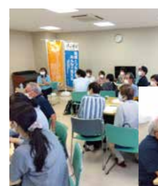
▲チームオレンジ意見交換会（9/25 実施）