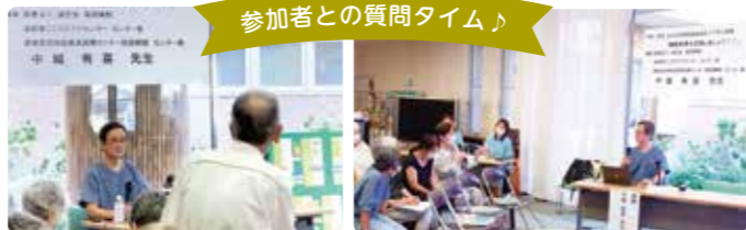
参加者との質問タイム♪