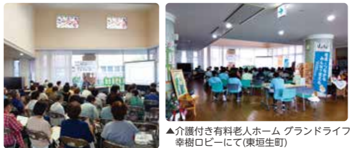
▲介護付き有料老人ホーム グランドライフ 幸樹ロビーにて(東垣生町)