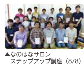
▲なのはなサロン ステップアップ講座(8/8)