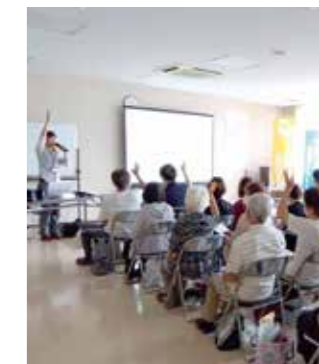
▲チームオレンジ説明会&ステップアップ講座（7/18 実施）