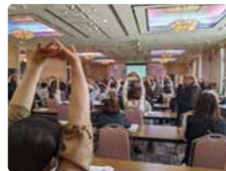
▲毎年行う認知症フォーラム（写真は2024年の様子）