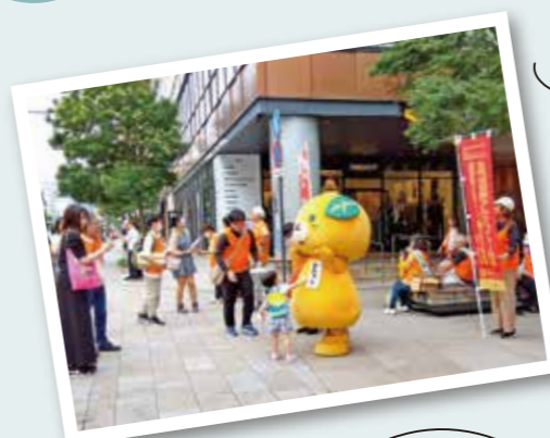
愛媛のマスコットキャラクター みきゃんも登場!子供たちに大人気!

オレンジは認知症の普及啓発のシンボルカラーです。認知症相談医をオレンジドクター、厚生労働省の認知症高齢者の施策をオレンジプランと言います。