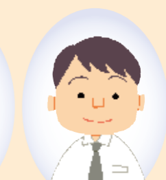
社会福祉士 (または福祉事務所業務 経験5年以上等)