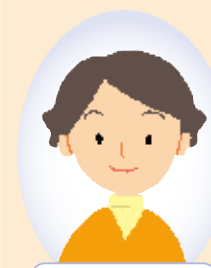
保健師 (または 経験豊富な看護師)