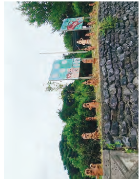
里山ふれあい広場のはにわ

里山ふれあい広場には、地域の小学6年生が卒業記念制作した「はにわ」が約1900体あります。里山友遊館には、東日本大震災の陸前高田市の仮設住宅が移設されています。