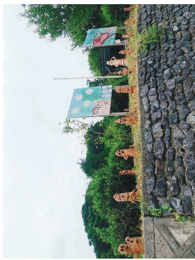
里山ふれあい広場のはにわ

里山ふれあい広場には、地域の小学6年生が卒業記念制作した「はにわ」が約1300体あります。里山友遊館には、東日本大震災の陸前高田市の仮設住宅が移設されています。