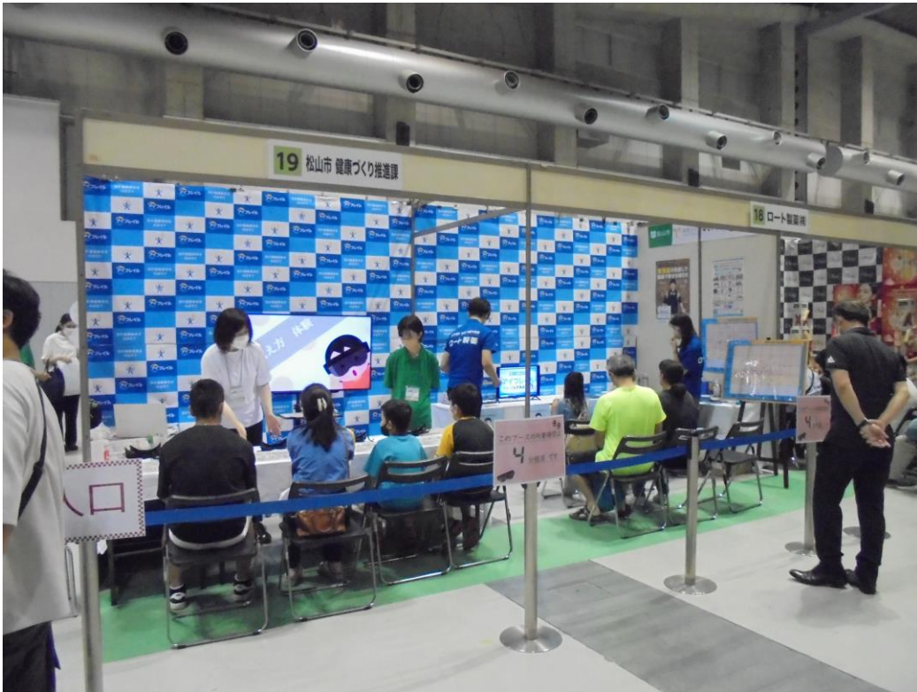
松山市とロート製薬で並んで出展

令和5年7月8日（土）～9日（日）にアイテムえひめで開催された、株式会社レデイ薬局主催の「健康フェスタ2023」に、松山市保健所健康づくり推進課がロート製薬株式会社と合同で出展させていただきました。