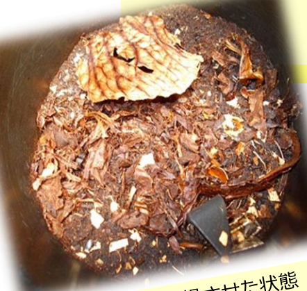
生ごみを乾燥させた状態