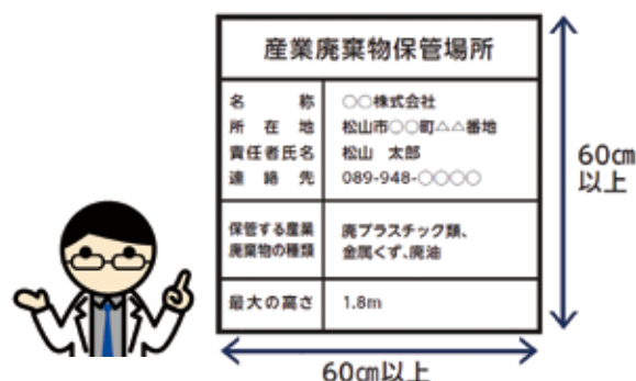
(産業廃棄物保管場所の表示の例)

Q4 建設工事で出る産業廃棄物を工事現場以外の場所で、保管する予定です。土地の面積が300㎡以上になります。事業場外保管の届出は必要ですか？