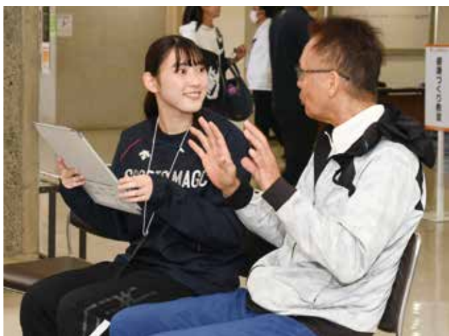
筋肉の質チェック