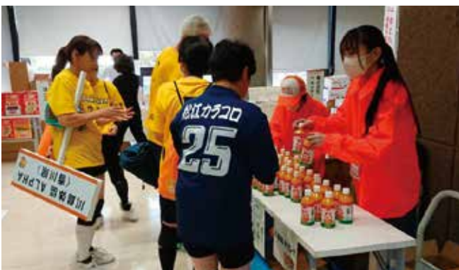
ポンジュースのふるまい