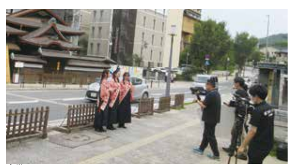
愛顔のリレーメッセージの動画撮影風景