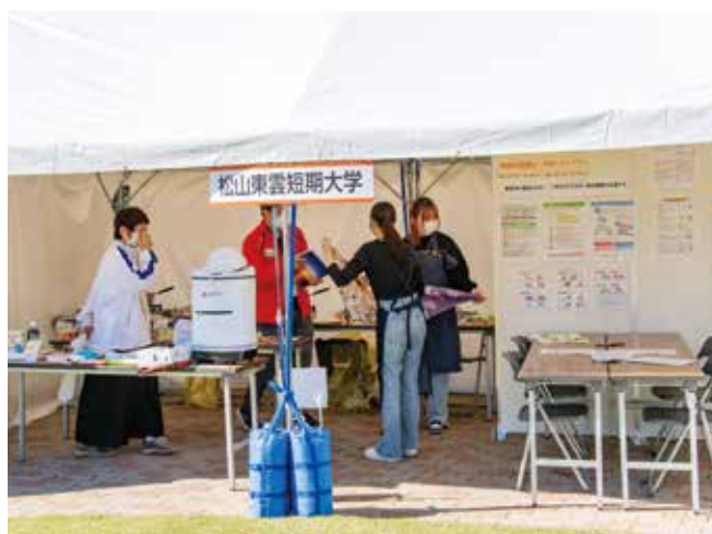
松山東雲短期大学「防災食体験」