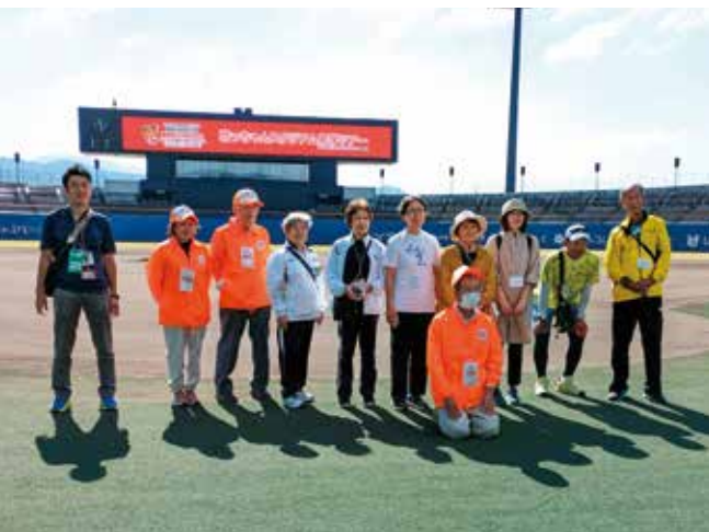
坊っちゃんスタジアム見学ツアー