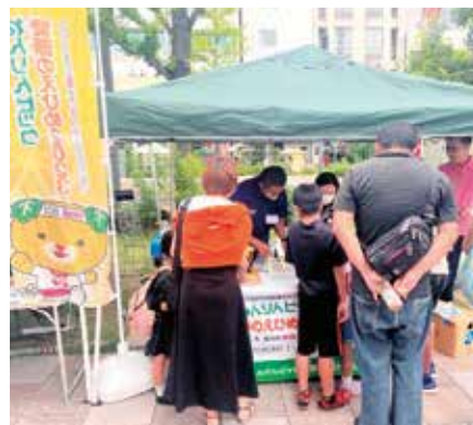
まつやま花園日曜日でのブース出展