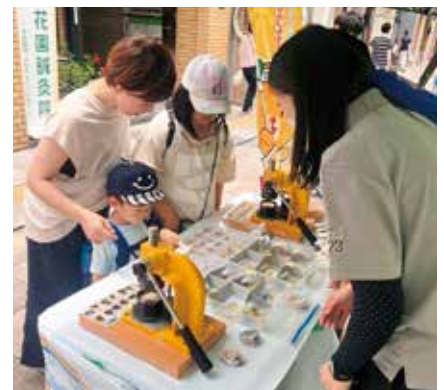
まつやま花園日曜日でのブース出展