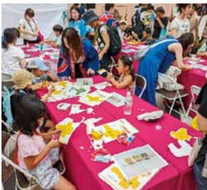
瀬戸内フェア 2023（東京都）での様子