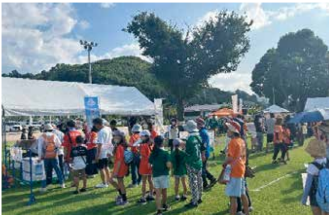
愛媛 FC 松山広域デーでのブース出展