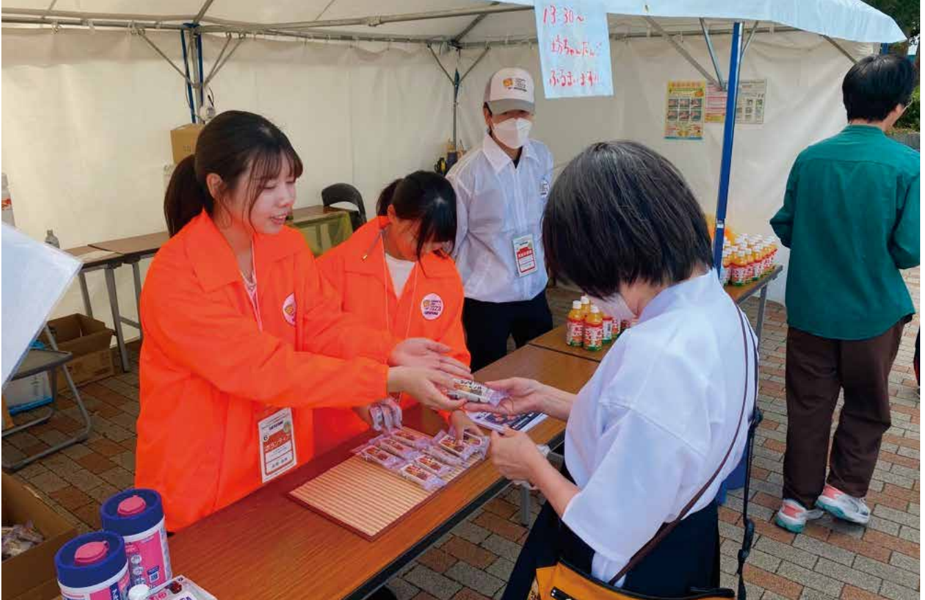
「坊っちゃん団子」のふるまい