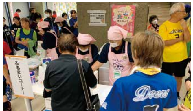
松山市食生活改善推進協議会による食のおもてなし（ひじきのもぶりずし）