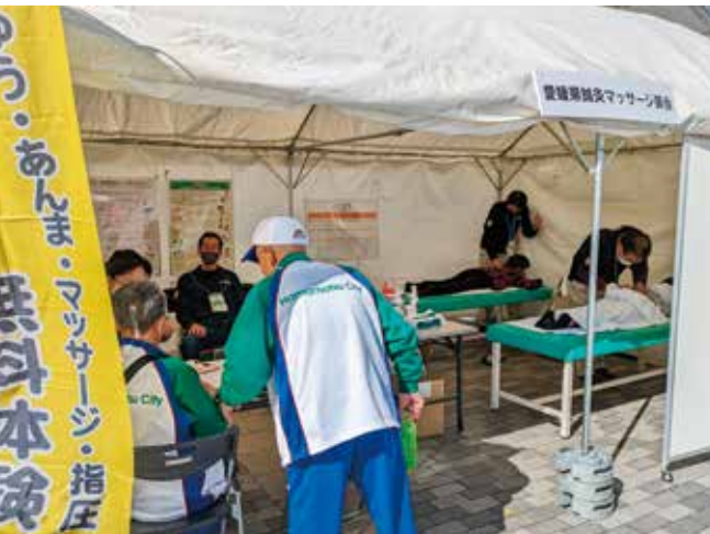
鍼灸マッサージ体験