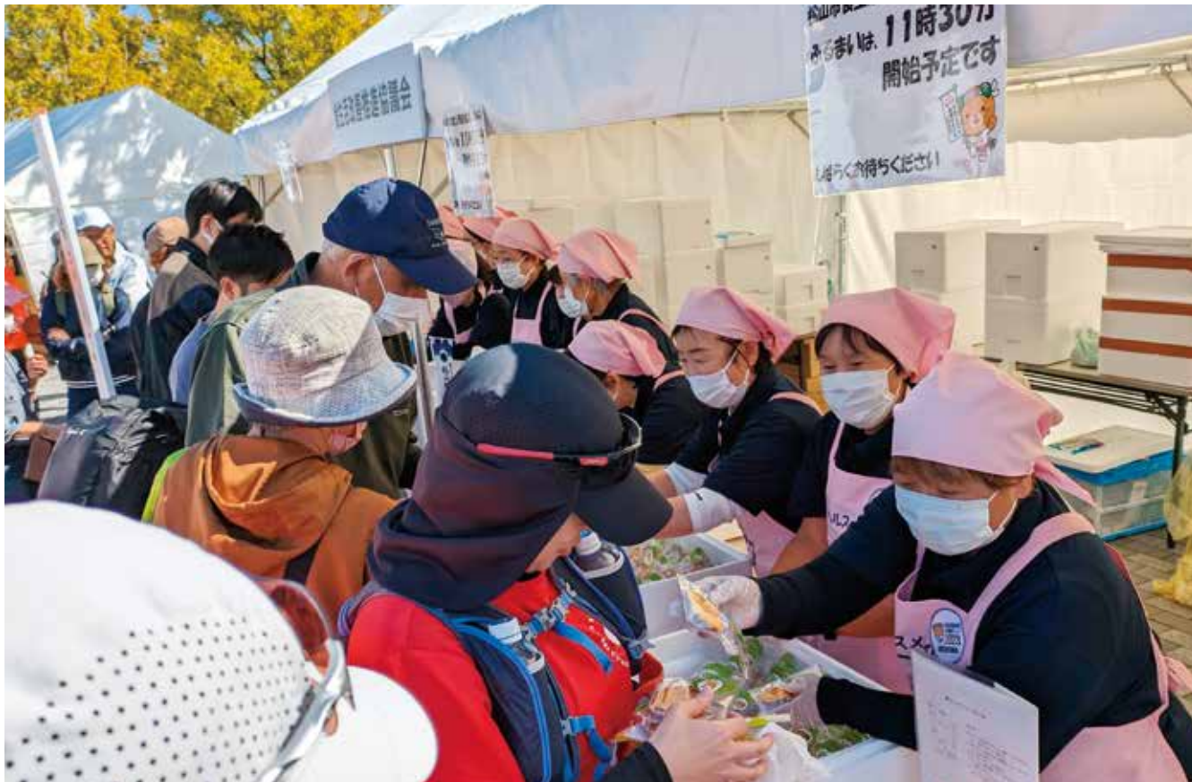
松山市食生活改善推進協議会による食のおもてなし (レモンマドレーヌ・ひじきのもぶり酢)

地域の団体や協賛企業の協力で、鯛めしや、ひじきのもぶり ずし など郷土料理をはじめ、蛇口からみかんジュースや、松山銘菓などをふるまい、特産品や土産物を販売しました。 また、健康づくりブースでは、専門職や学生の皆さんが、お薬や口腔機能、栄養や健康に関する相談やマッサージ体験など、趣向を凝らした健康関連ブースを出展しました。