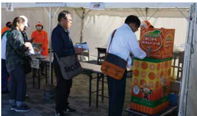
愛媛名物「蛇口からみかんジュース」の実演試飲会