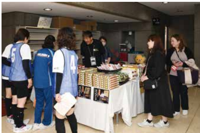
みきゃんグッズ、松山銘菓など