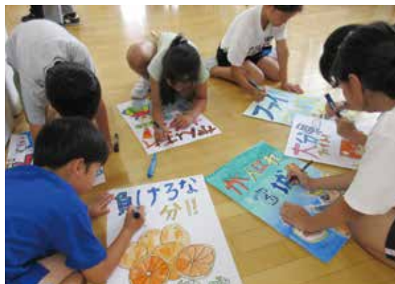
松山市立東雲小学校