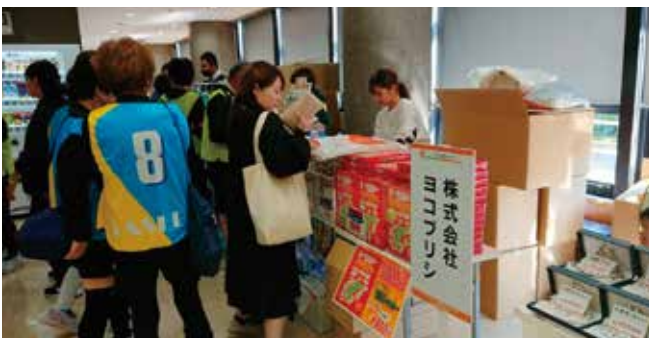
ねんりんピック記念グッズ、お菓子など