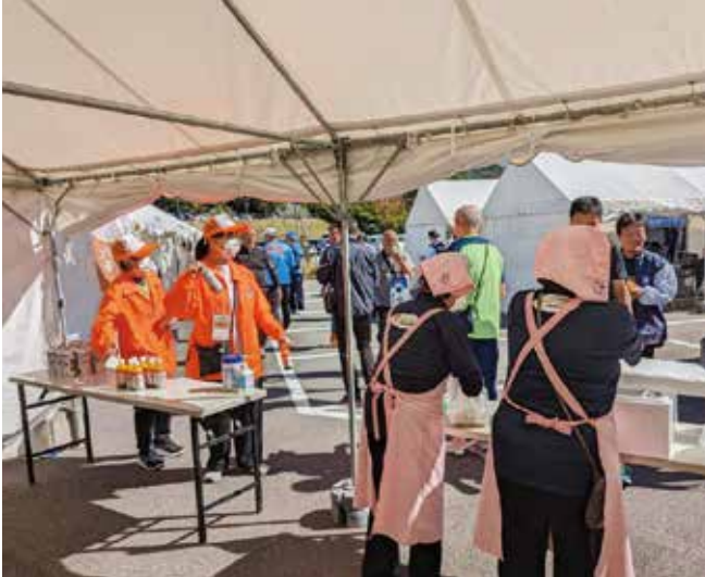
松山市食生活改善推進協議会による食のおもてなし(ひじきのもぶり ずし ・鯛めし)

また、専門職による栄養や健康に関する相談や、聖カタリナ大学の皆さんが、測定器具を用いた健康チェックなど、趣向を凝らした健康関連ブースを出展しました。