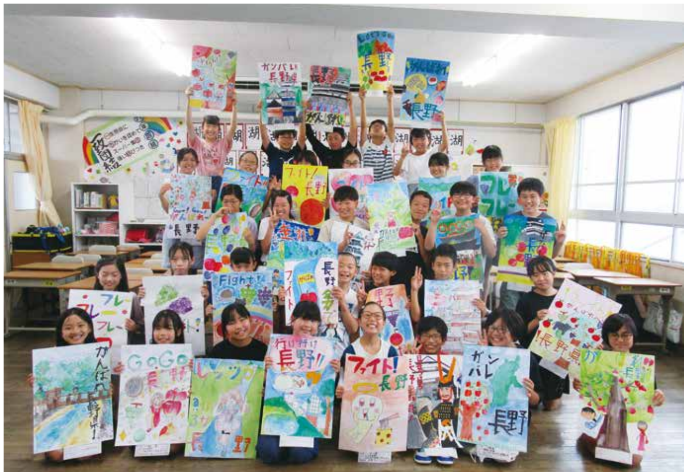
松山市立石井東小学校

47 都道府県・20 政令指定都市の各選手団を温かい心でお迎えするため、松山市内の小中学校の児童・生徒の皆さんが描いた応援イラストをのぼり旗にし、各会場を華やかに彩りました。また、市役所や大会会場で応援イラストの原画展を行い、大会の機運醸成を図りました。