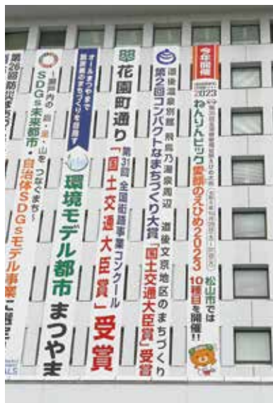
懸垂幕 (市役所本庁舎壁面)