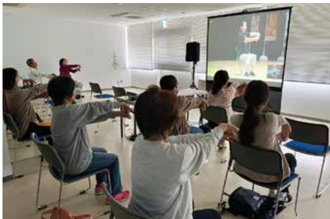
「SAMさんと一緒に踊って学ぼう！」サテライト中継