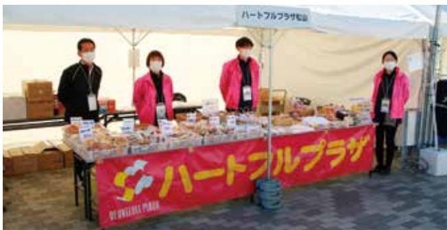
クッキー・マドレーヌなどの洋菓子販売