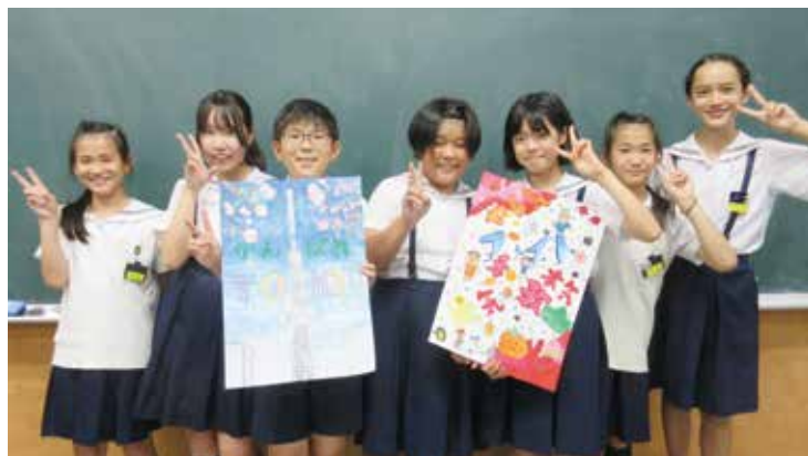
松山市立湯築小学校