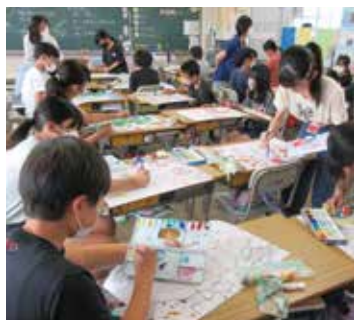
松山市立石井東小学校