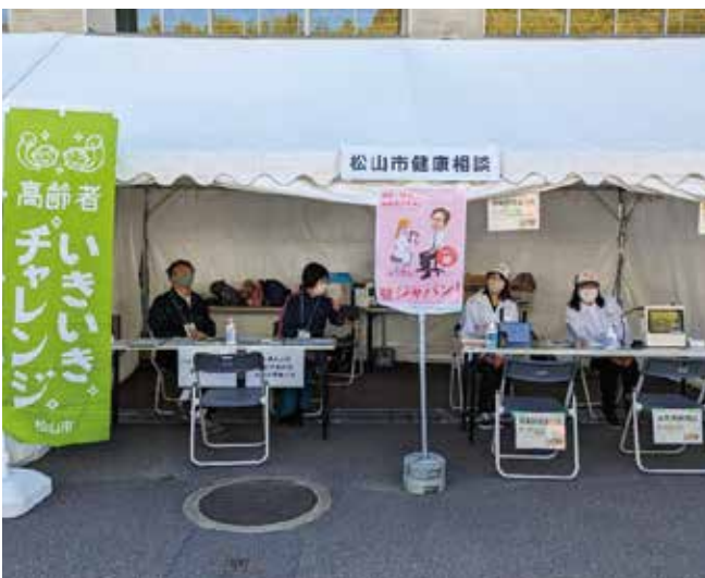
高齢者いきいきチャレンジ啓発