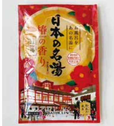
入浴剤 (日本の名湯 椿の香り 道後)