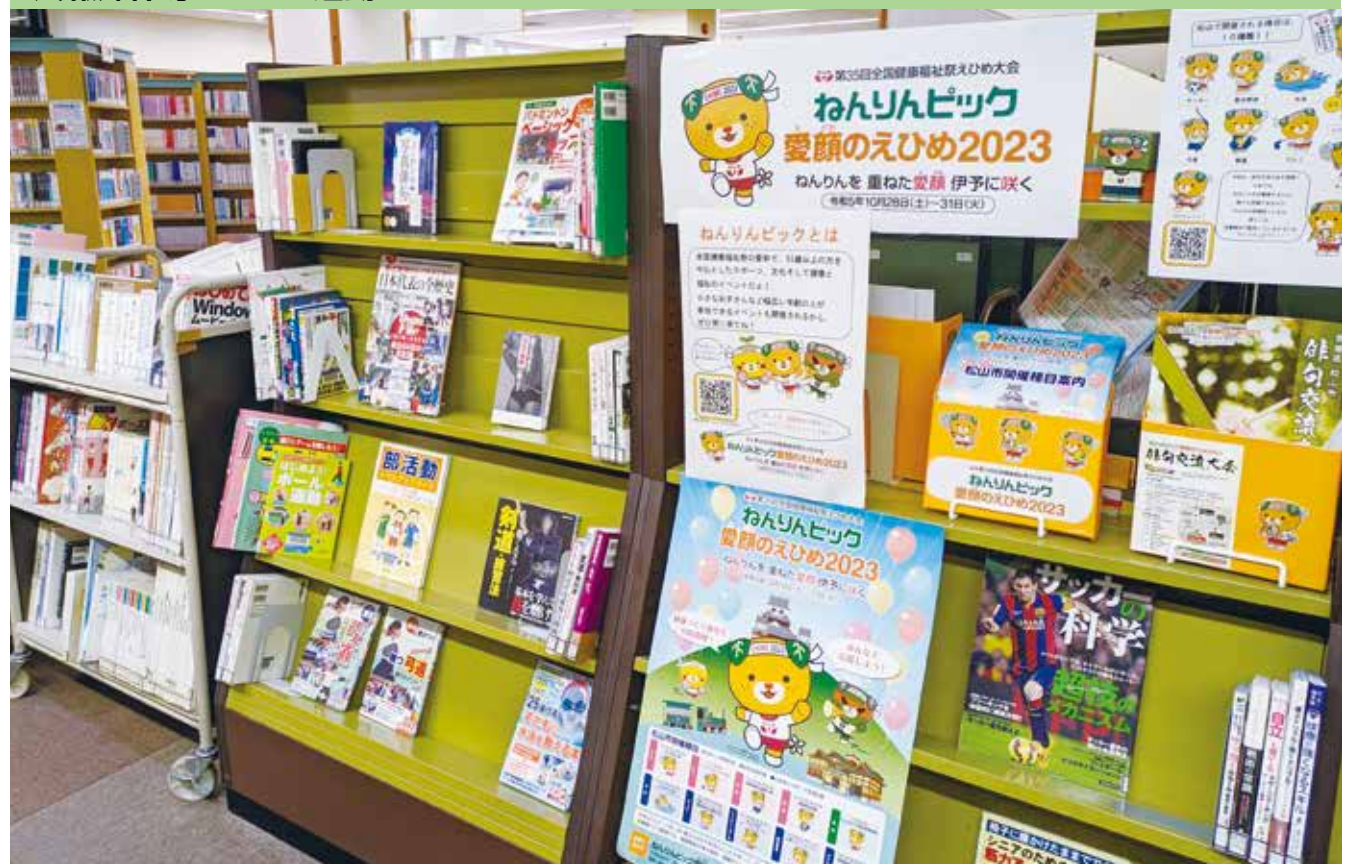
松山中央図書館でのコーナー設置