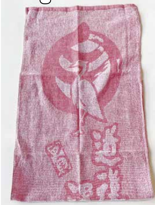
道後温泉本館オリジナルタオル