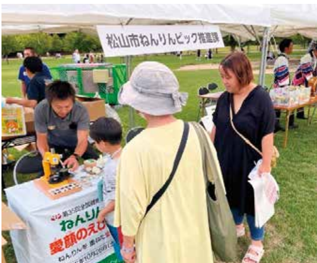
松山野球拳おどりでのブース出展