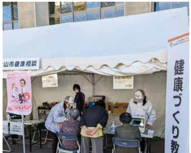
保健師による健康相談