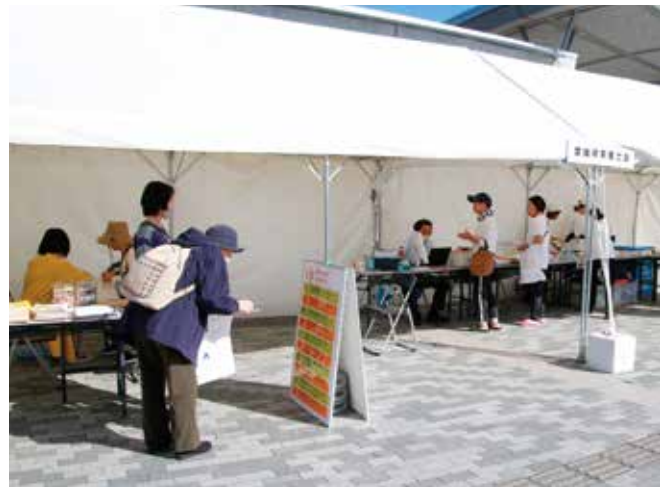
栄養バランスチェック