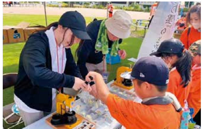
愛媛 FC 松山広域デーでのブース出展