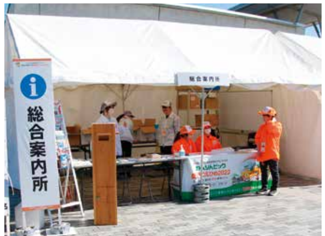
総合案内所で観光情報や開催競技を案内