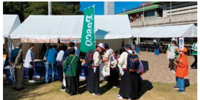
「みきゃんのパンケーキ、ロングライフブレッド等」のふるまい