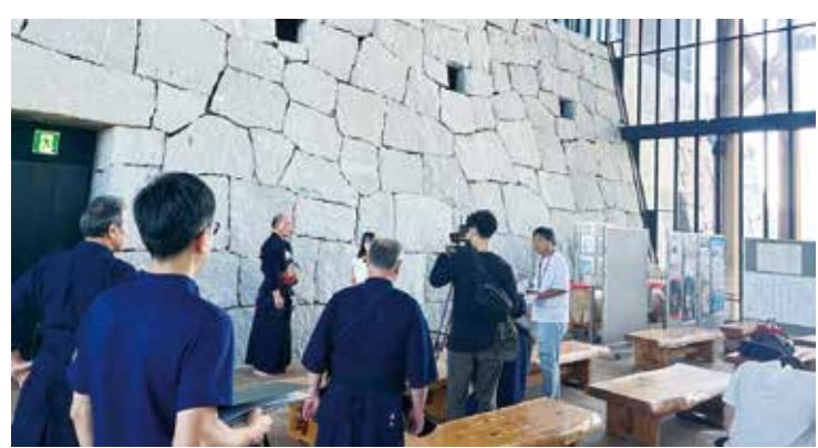
広報テレビの撮影風景