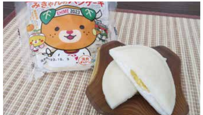
ねんりんピックコラボ商品「みきゃんのパンケーキ」