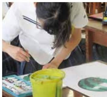
松山市立拓南中学校