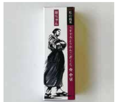
薄墨羊羹こざくら