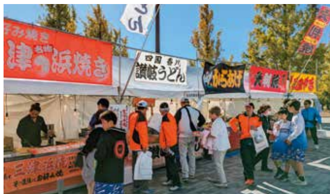
屋台グルメの販売