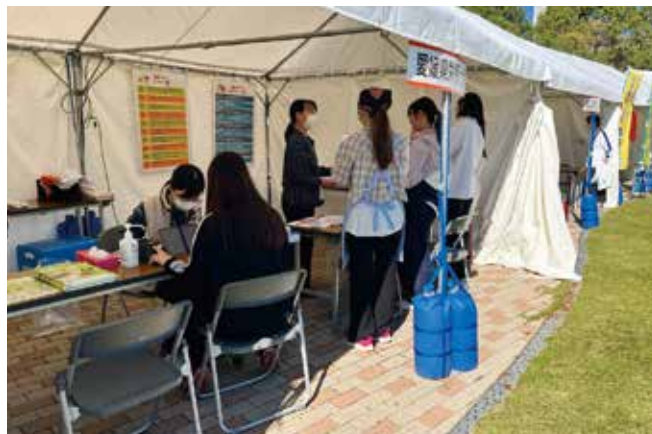
野菜摂取状況チェック