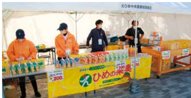
温州みかん詰め放題