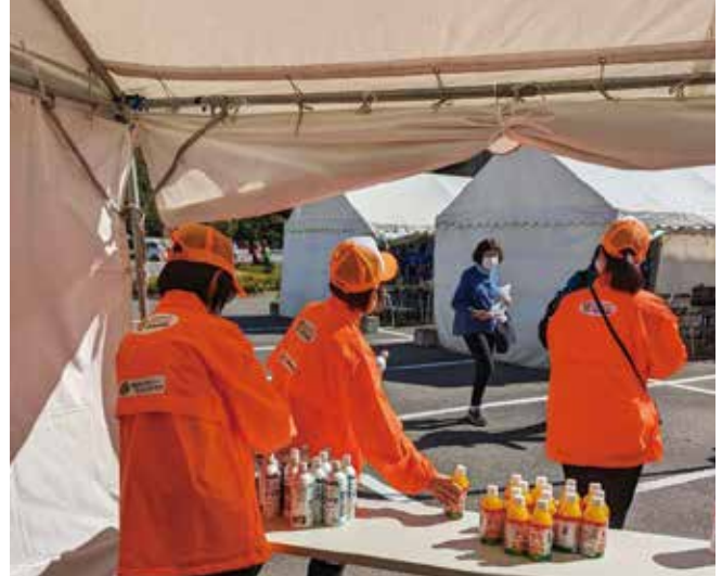
ポンジューズのふるまい