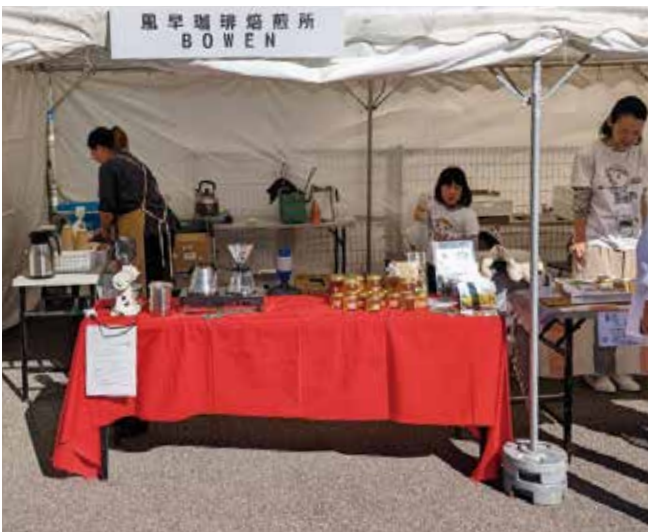
珈琲など飲食物の販売