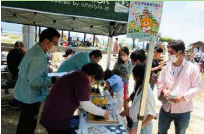
北条鹿島まつりでのブース出展