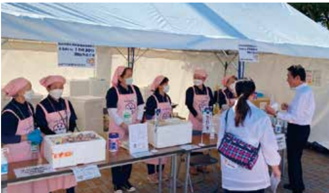
松山市食生活改善推進協議会による食のおもてなし