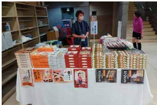
みきゃんグッズ、松山銘菓など