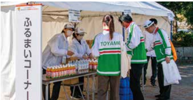
ポンジュースのふるまい