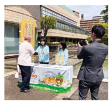
民間情報誌広告掲載での取材対応