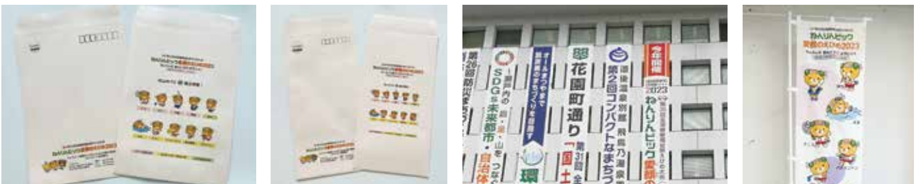
実行委員会封筒 (角2)