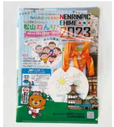
クリアファイル (チラシ、メダル入り)