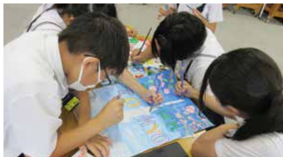
松山市立湯築小学校