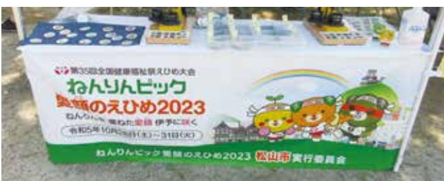
装飾用テーブルクロス