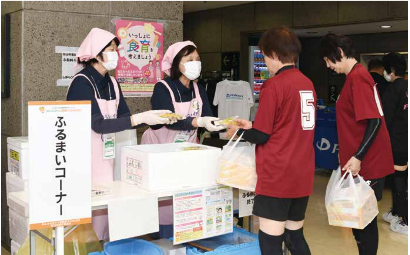
松山市食生活改善推進協議会による食のおもてなし（ひじきのもぶりずし）

健康づくりブースでは専門職や学生の皆さんが、体組成計などの機器を用いた健康チェック、はりやテーピングなどの体験のほか、体操、ストレッチ、エクササイズや筋トレのミニ講座を行いました。