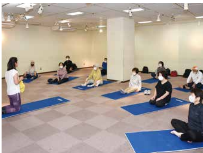
ミニ講座「ストレッチ」