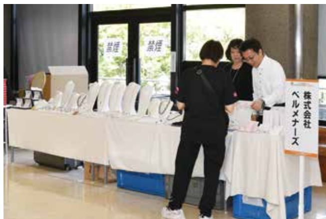
ネックレスほか真珠製品