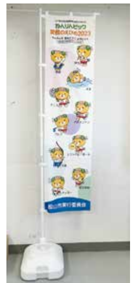
啓発のぼり旗 (各競技会場等)