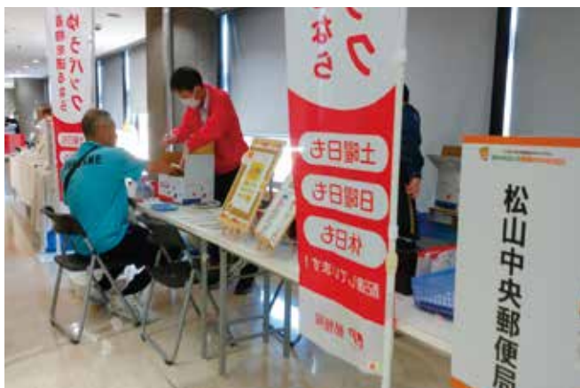
オリジナルフレーム切手、宅配