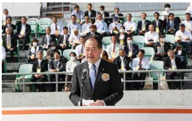
市長による開会宣言