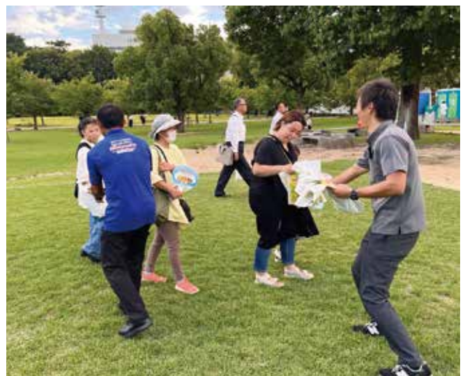
松山野球拳おどりでのブース出展