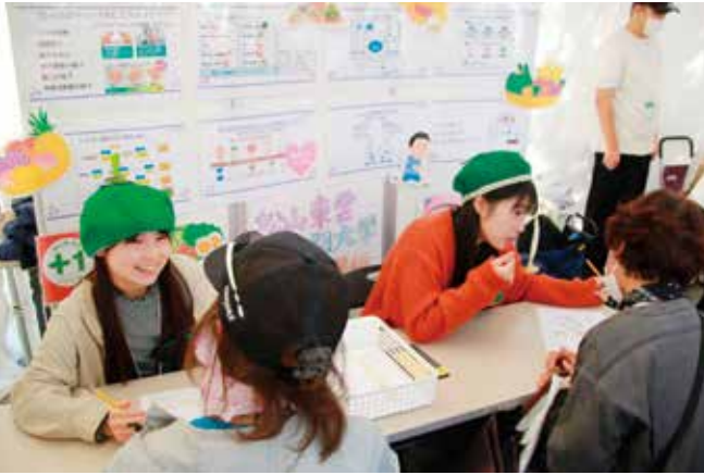
松山東雲短期大学ののめベジガールによる「食生活チェック」