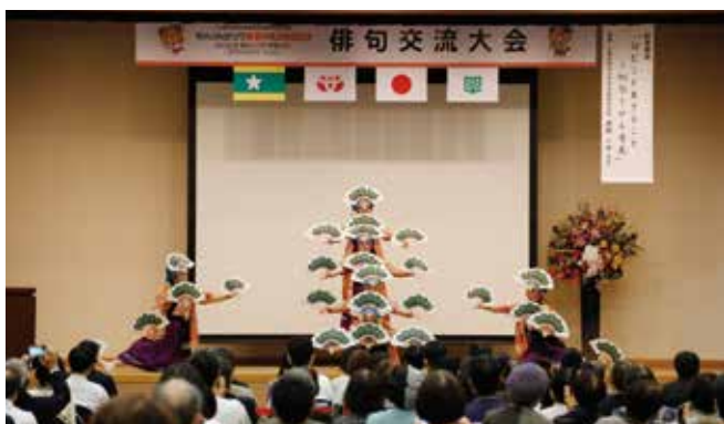
歓迎アトラクション【伊予万歳（溝辺つばき会）】