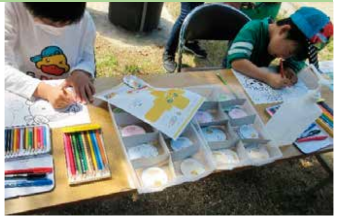
北条鹿島まつりでのブース出展