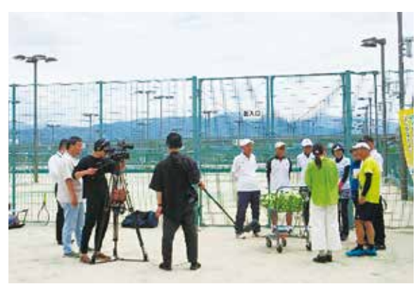
広報テレビの撮影風景