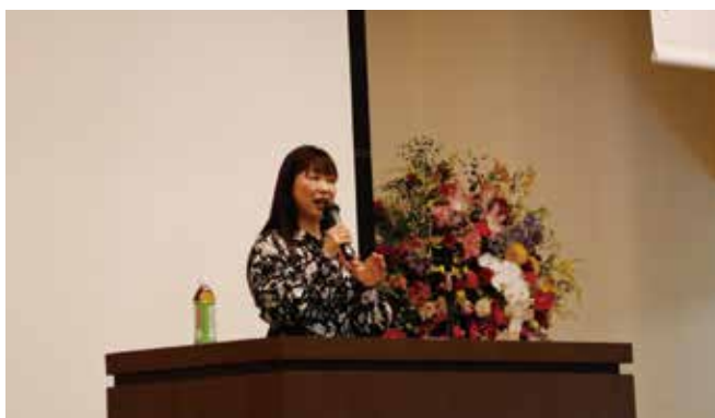
成田一子先生による記念講演