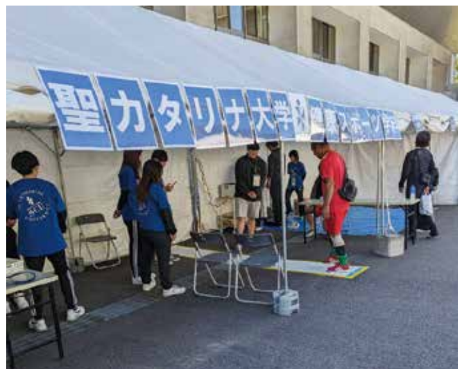
聖カタリナ大学による健康体力測定