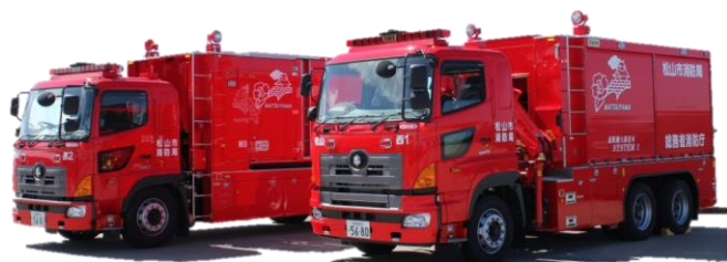
海水利用型消防水利システム