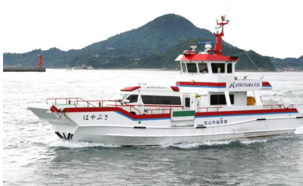
消防救急艇「はやぶさ」