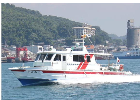
消防救急艇「うみねこ」