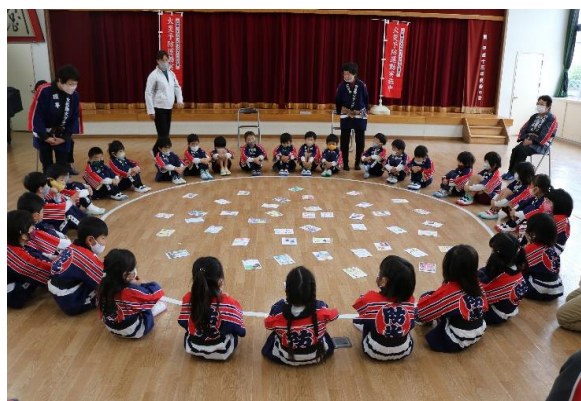
かるたを使った防災学習の様子