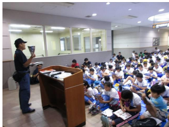
「一日消防学校」での学習の様子