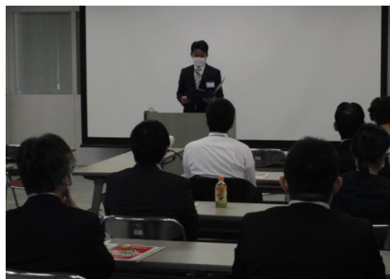
「防火研修会」の様子