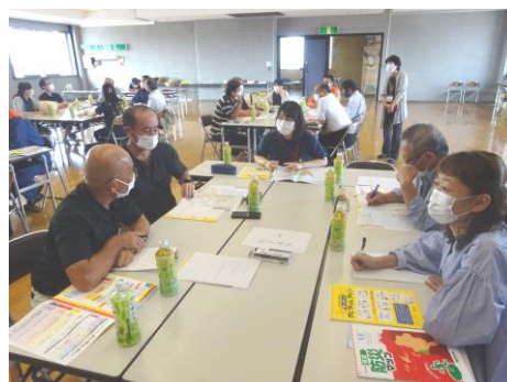
マイ・タイムライン講師養成講座

また、自主防災組織に公費で118名の防災士を養成し、松山市は全国1位の防災士数を堅持しています。(8,339人、R5.4.末)