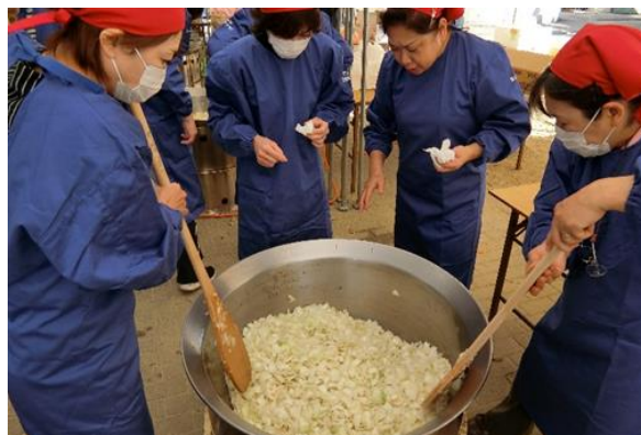
「松山市総合防災訓練」での炊出しの様子

令和5年4月1日現在のクラブ数は、39クラブ(地区)、クラブ員数74,621名です。