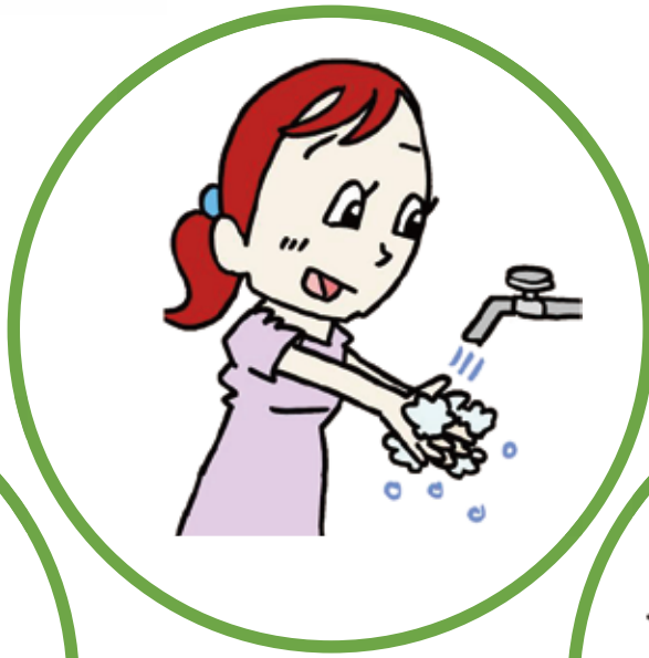
手洗い・手指消毒