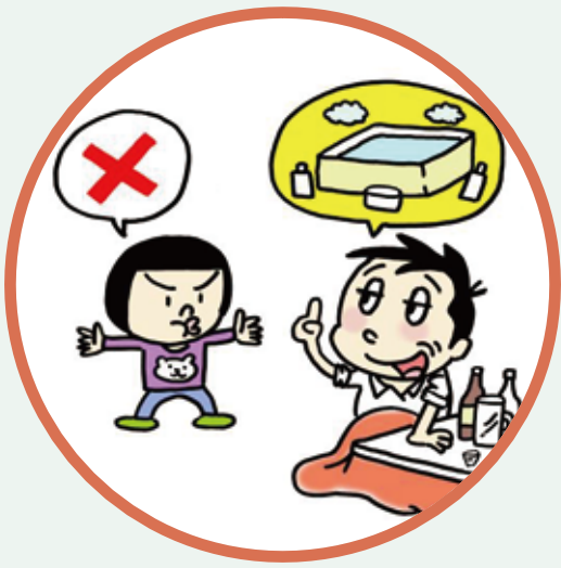
食事直後・飲酒時は控える