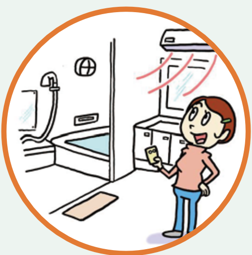
入浴前に暖めておく