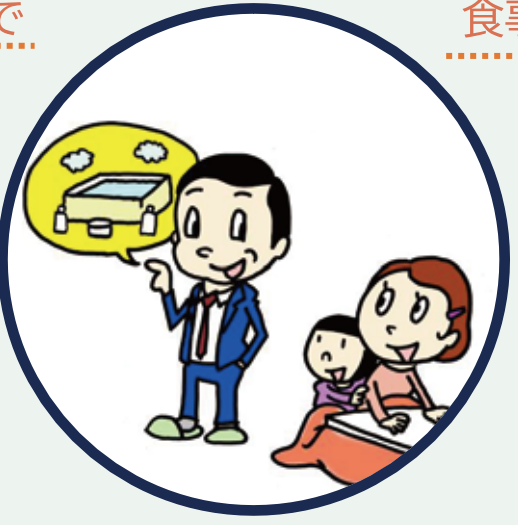
家族がいる時間に