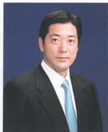
松山市長 中村 時広