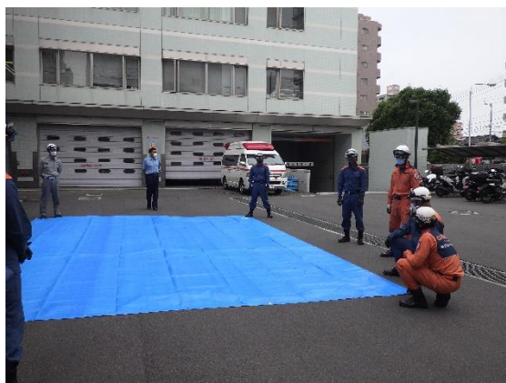
ブルーシートの取扱い説明