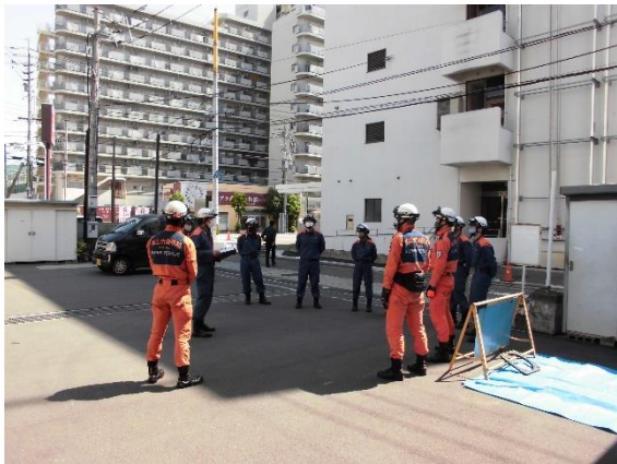
保有状況説明（水防資機材・土のう備蓄）