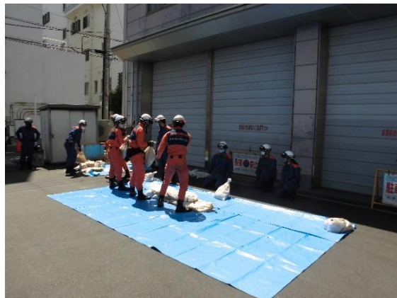
改良積み土のう工Ⅱ 作成要領②