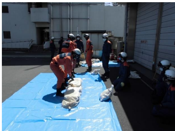
改良積み土のう工Ⅱ 作成要領①