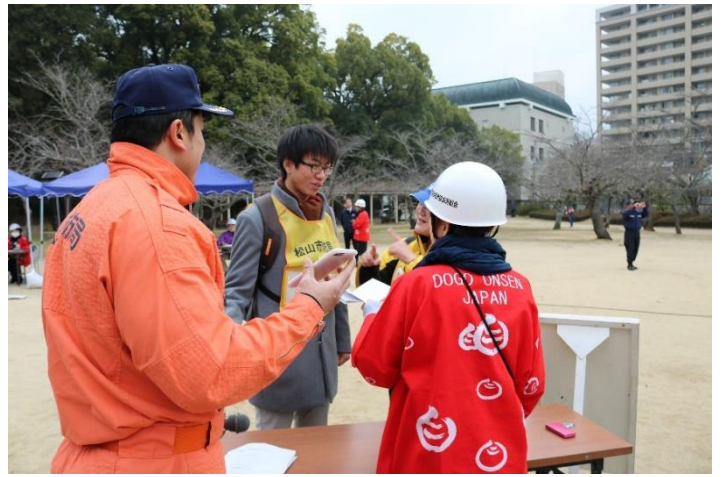
8. 外国人の対応状況