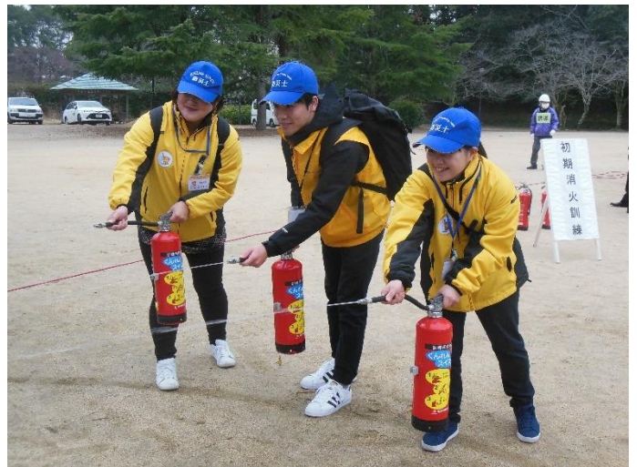
12. 訓練状況 (水消火器取扱い)