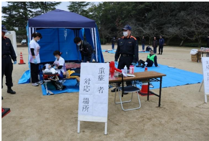
9. 看護師による重傷者処置状況