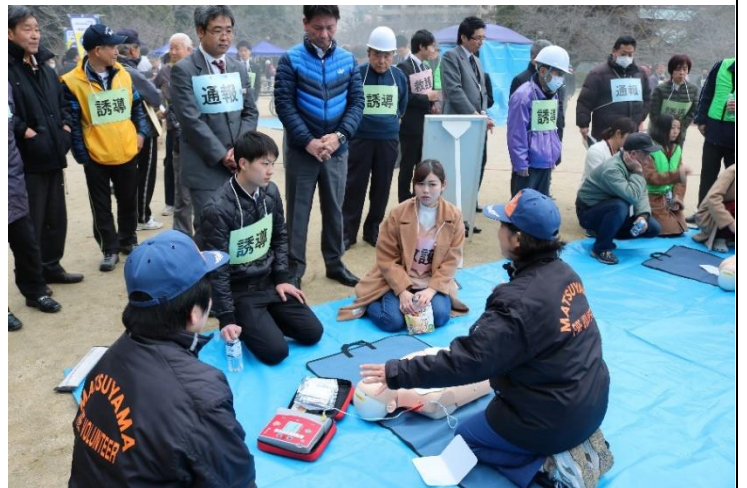
10. 訓練状況 (心肺蘇生法・AED取扱い)