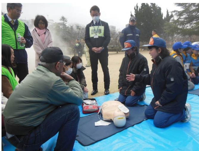
11. 訓練状況 (心肺蘇生法・AED取扱い)