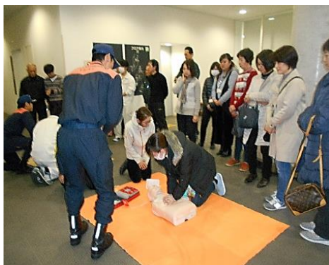
AEDを使った救命講習