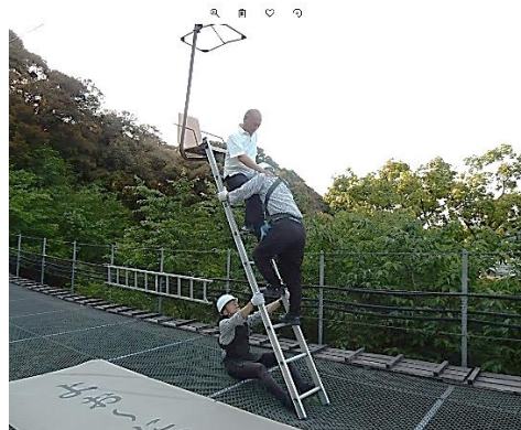
リフト乗客のはしご救助訓練