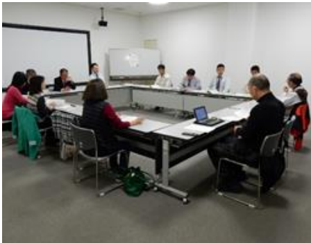
毎月開催しているリーダー会議