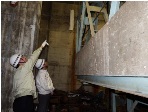
安全統括管理者と松山城総合事務所長の索道施設巡視

日々の点呼を強化すると共に、責任者の定期的な施設巡視を通じ運行管理・施設保守に関する情報を収集し管理を強化しました。