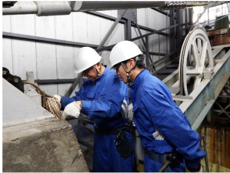
緊張場(おもり)の点検