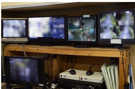
運転室内の監視カメラモニター（保安上の理由で画像を一部加工しています）

山麓、山頂の駅舎各所に監視カメラを設置しており、不審者や不審物などの監視体制を整えています。