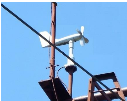
ロープウェイ支柱に設置した風速計

ロープウェイ鉄塔に2か所風向風速計を、リフトの支柱に1か所風速計を設置しています。規定値以上の風速を観測した場合は、減速・停止などの措置をとっています。