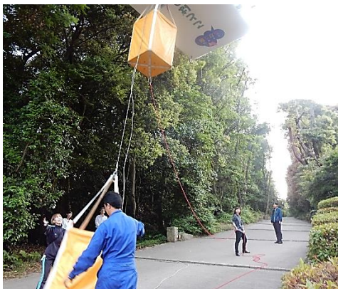
ロープウェイ乗客の降下救助訓練