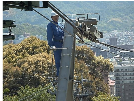
支曳索(ワイヤロープ)の点検