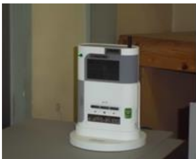
緊急地震速報受信装置（平成 24 年 4 月より運用開始）

気象庁の発表する緊急地震速報を活用した緊急地震速報受信装置を導入しています。速報を受信した場合、迅速に対応できるようにしています。