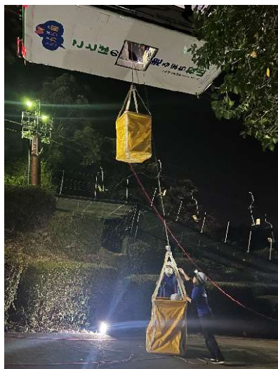
ロープウェイの救助訓練

ロープウェイでは異常時を想定した停止訓練や緊急降下用具を使用した搬器からの救助訓練を、リフトでは「はしご」を使用した救助訓練を毎月実施しているほか、安全に関する講習を定期的に行い、実務に即した教育訓練や改善など専門的資質の向上を図っています。