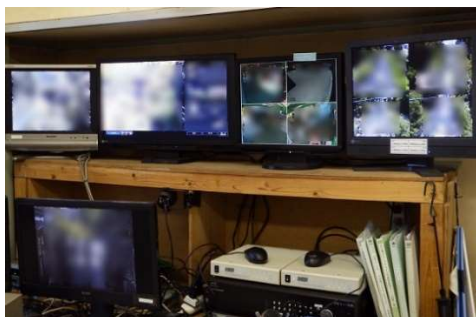
運転室内の監視カメラモニター(保安上の理由で画像を一部加工しています)

山麓、山頂の駅舎各所に監視カメラを設置しており、不審者や不審物などの監視体制を整えています。