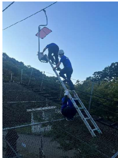
リフトの救助訓練