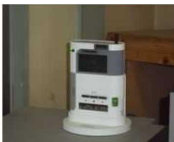
緊急地震速報受信装置

気象庁の発表する緊急地震速報を活用した緊急地震速報受信装置を索道運転室に設置しています。速報を受信した場合、速やかに安全確保のための措置を取れるようにしています。