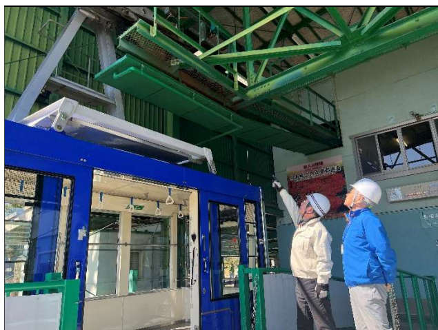
安全統括管理者(左)による設備巡視

日々の点検を強化すると共に、安全統括管理者と施設責任者（所長・副所長）の定期的な施設巡視を通じ、運行管理・施設保守に関する管理を行っています。