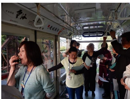
ロープウェイ乗務員による停止訓練

マニュアル類を作成し、平常時の厳正な運行管理ならびに事故発生時の停止訓練の習熟を図り、搬器の点検項目を明確化しました。