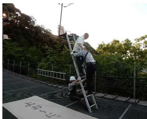
リフトの救助訓練

ロープウェイでは異常時を想定した停止訓練や緊急降下用具を使用した搬器からの救助訓練を、リフトはハシゴを使用した救助訓練など、様々な状況を想定した訓練を月1回以上実施しています。