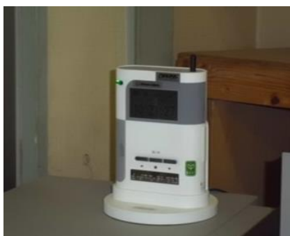
緊急地震速報受信装置 (平成 24 年 4 月より運用開始)

気象庁の「緊急地震速報制度」を活用し運転室に緊急地震速報受信装置を導入しています。速報を受信した場合、迅速に対応できるようにしています。