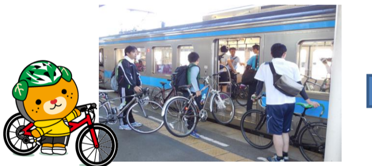
自転車をそのまま電車に持ち込みます