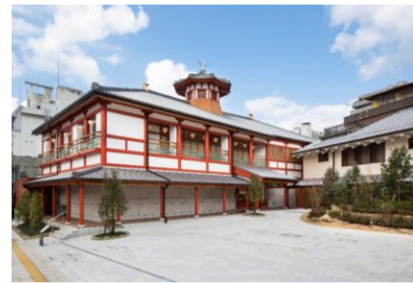
道後温泉別館 飛鳥乃湯泉