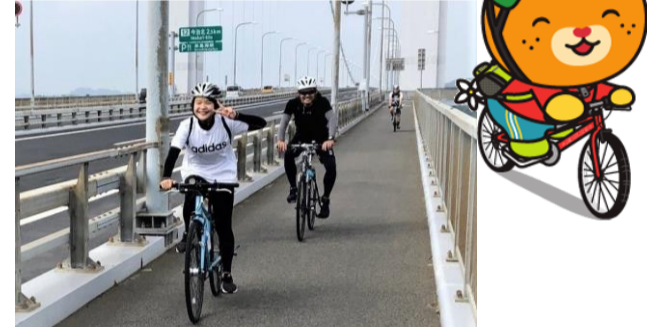
しまなみ海道サイクリングへ!