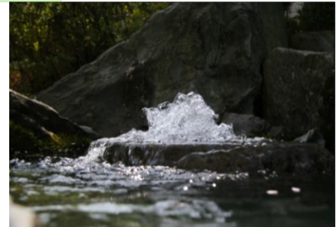
西条の名水「うちぬき」