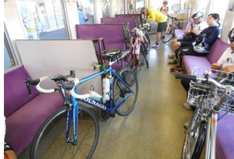
電車の旅を楽しみます♪