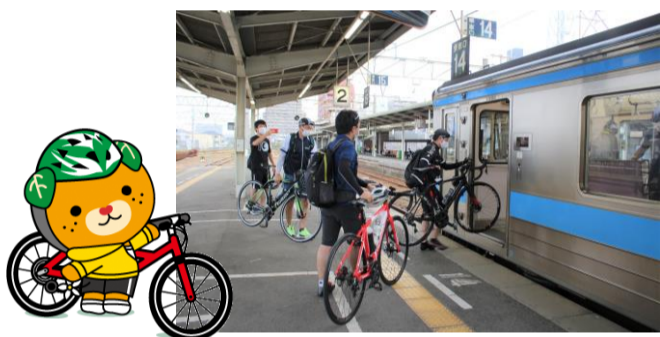
自転車をそのまま電車に持ち込みます