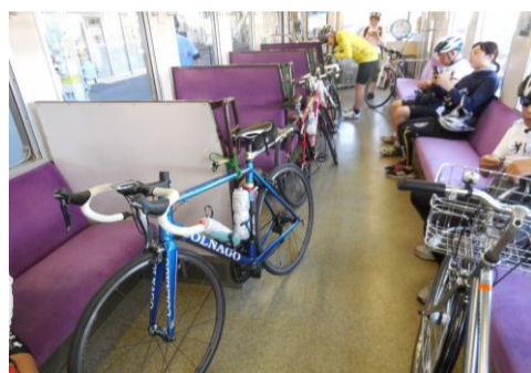
電車の旅を楽しみます♪