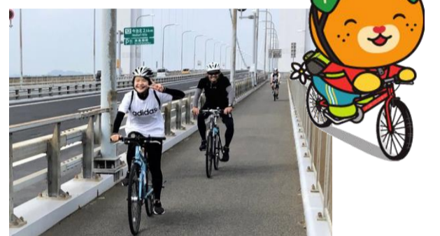
しまなみ海道サイクリングへ!