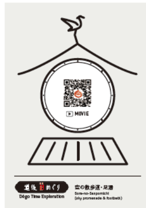
まつやま道しるべマップ