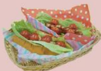
24ページ ホットドッグ