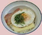
4ページ 目玉焼き丼