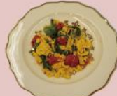
8ページ 卵とトマトの洋風炒め