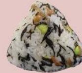
6ページ 枝豆とひじきのおにぎり