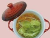
12ページ 野菜スープ