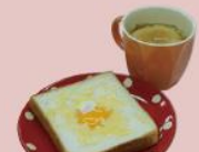
23ページ エッグトースト~具たくさんスープ添え~