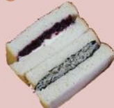
5ページ サンドイッチ