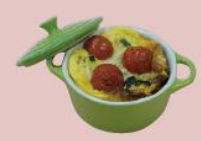
27ページ 野菜オムレツキッシュ