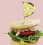
26ページ がさつ女子のイングリッシュマフィンサンド