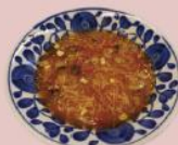
13ページ トマトスープ