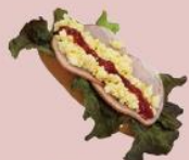
25ページ ハムエッグサンド