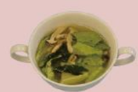
15ページ レタスのみそ汁