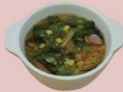
10ページ 簡単スープ