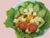
11ページ フルーツサラダ