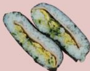
20ページ おにぎらず