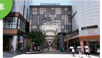
松山市中心部にある大街道商店街

松山市を代表する巨大なアーケード商店街の大街道・銀天街や道後温泉本館と道後温泉駅を結ぶ道後商店街を散策し、松山市の魅力を感じていただけます。もちろん、土産物屋でのショッピングも!