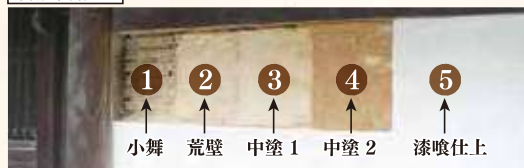
※調査段階のため未確定

漆喰壁を構成する層。漆喰壁を解体すると、仕上と推測される層を見ることができ、修理の履歴が分かりました。①小舞(土壁の地下)や古い土壁が残っていることから建築当初の材料や壁の構成を確認でき、また、建物の保存状態が良いことが分かりました。