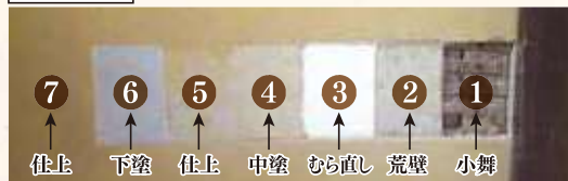
※調査段階のため未確定