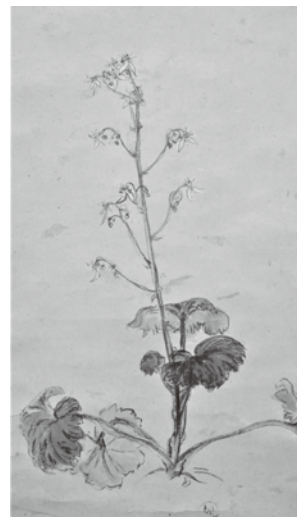
子規画「雪ノ下」 ※平成30年度新収蔵・初展示資料