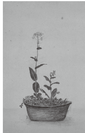
子規画「菜の花」図 (松本市美術館所蔵)