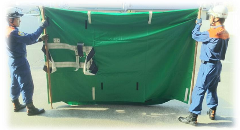
プライバシー保護シート