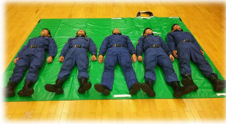
トリアージシート