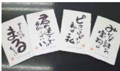
〔福祉施設が制作・販売するはがき〕