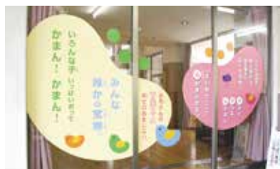
〔幼稚園の出入り口〕