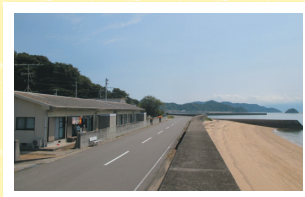
▲左側に見えるのが「神浦定住促進住宅」

忽那諸島は、穏やかな瀬戸内に位置します。島内のいたる所から海が見え、小高い場所からは、瀬戸内の多島美を臨めます。