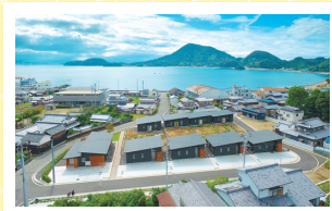
▲交流の会場となる「ハイムインゼルごごしま」

1日目は、H29年4月にオープンしたお試し移住施設「ハイムインゼルごごしま」を見学し、先輩移住者と交流します。2日目も地元の方や先輩移住者と交流会を予定していますので、たっぷり島のハウツーを教えてもらえます!