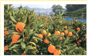
▲12月は、温州みかんの収穫最盛期です。

島しょ部の主要産業は柑橘栽培で、10月～5月まで、様々な柑橘が収穫されます。今回、先輩移住者のみかん畑で、先輩のお話を聞きながら収穫体験ができます。