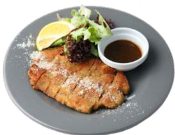
山口県萩市 むつみ豚のミラノ風カツレツ マルマレットソース ¥980