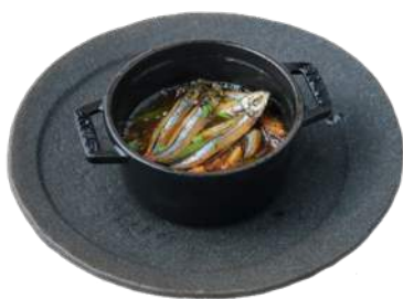
鹿児島県薩摩川内市 甕島産きびなごのアヒージョ ¥780