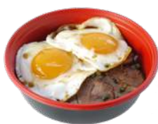
愛媛県今治市 焼き豚玉子飯 ¥760