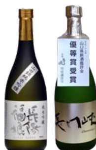
左：<岩崎酒造>長陽福娘 純米吟醸 ¥1,750 右：<岡崎酒造>長門峡 純米吟醸 ¥1,760