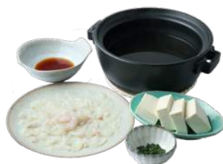
萩市産ふぐの湯豆腐 ¥980