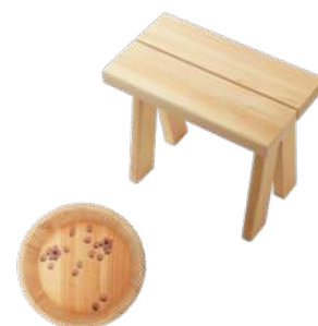
<YUIRO>上：湯椅子 浮雲 ¥8,000 下：湯桶 四季折々 さくら ¥8,500