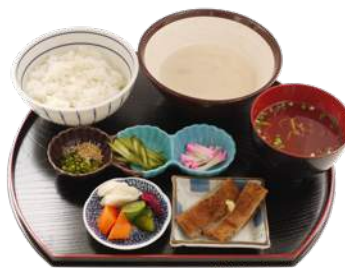
伊予さつま御膳 (じゃこ天+鯛のすまし汁付) ¥907