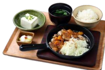
鹿児島黒豚 豚テキ定食 -金柑の香り- ¥834