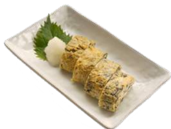
松山ひじきのだし巻きたまご ¥500