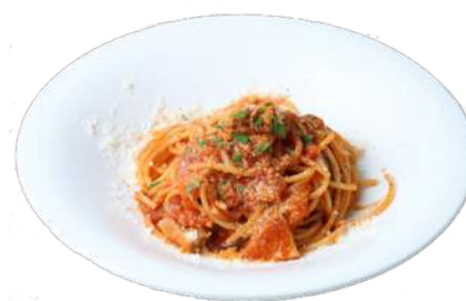
山口県萩市 見蘭牛もつのトマトラグー 生スパゲティー ¥1480