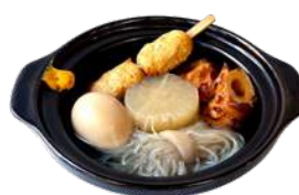
おでんの盛り合わせ 5種 ¥580