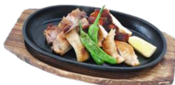
媛っこ地鶏の鉄板焼き ¥800