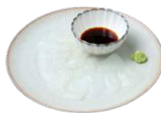
甌島産アロエのお刺身 ¥480