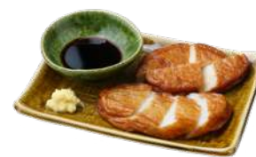
薩摩川内つけ揚げ2種 ¥420