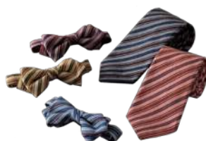
伊予紘 左：蝶タイ ¥4,500 右：ネクタイ ¥7,000