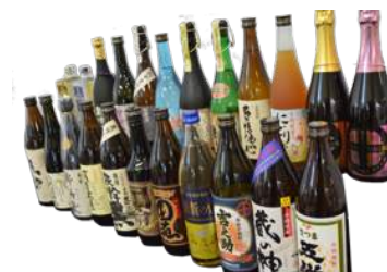
薩摩川内市の焼酎各種 ¥400～