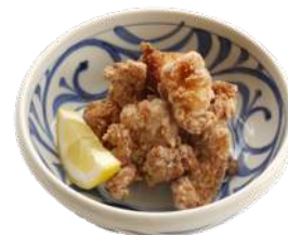
松山ソウルフード ざくざく唐揚げ ¥500