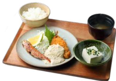
瀬付きアジのフライ定食 ¥741