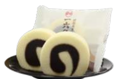
<一六本舗>ひと切れ一六タルト「柚子」 ¥390