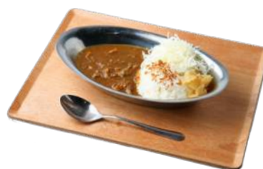
見蘭牛スジカレー ¥814