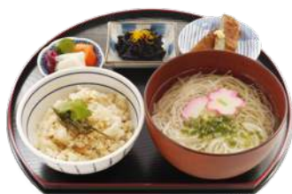
鯛めし膳 (小鉢+五色そうめん付) *鯛めしは、2種類のうちどちらかを選択 ・松山 (中・東予地方) の鯛めし ¥1,019 ・南予地方の鯛めし ¥1,111