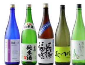
日本酒各種 八千代 (グラス) ¥500 宝船 (グラス) ¥550 長陽福娘 (グラス) ¥600 長門峡 (グラス) ¥550 東洋美人 (グラス) ¥580