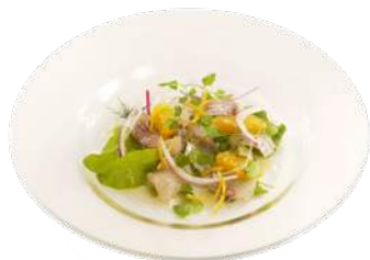
鯛の昆布メカルパッチョ - 柑橘ドレッシング - ¥600