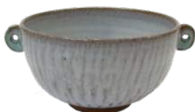
萩焼 緑彩スープカップ ¥4,000