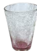
萩ガラス テーパーグラス ¥6,000