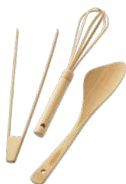
竹工芸 キッチンツール 左：トンゴ (大) ¥1,000 中：米とぎマドラー ¥900 右：万能べら (右利き用) ¥1,200