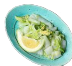
白菜と萩柑橘の浅漬け ¥250