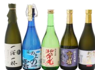
俳句にちなんだお酒 (1月) ¥600~ *1月の俳句： 「十年の汗を道後の温泉に洗へ」 正岡子規