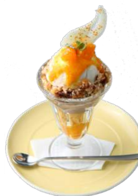
愛媛県松山市 松山柑橘の旅するパフェ ¥950

*ランチタイムには、旅するONE DISH (¥200～) もご用意しております。