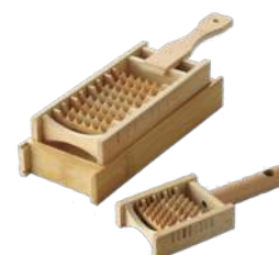
左：鬼おろし&専用受皿セット ¥4,000 右：鬼おろし (ミニ) ¥1,500