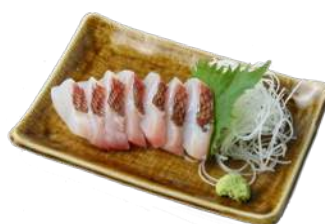
<木曜日限定> 萩市から本日届いた鮮魚のお刺身 時価