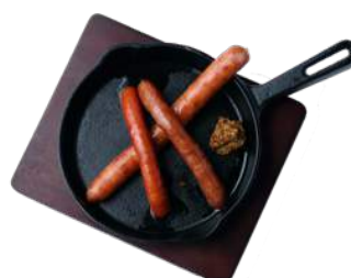
見蘭牛とむつみ豚のソーセージ 盛り合わせ ¥830