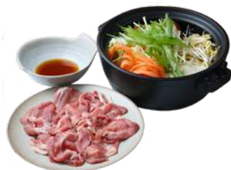
鹿児島黒豚とレタスのしゃぶしゃぶ ¥1,200