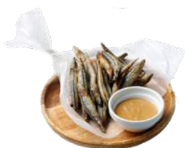
甌島産きびなご唐揚げ ¥680