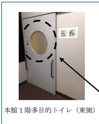
本館1階多目的トイレ(東側)