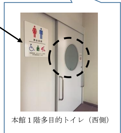
本館1階多目的トイレ(西側)