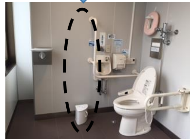
本館1階多目的トイレ(東側)