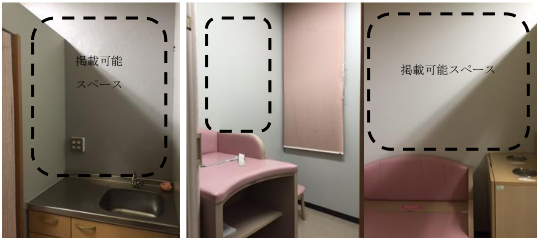
本館1階フロアのベビールーム

※ベビールームの壁面には、子育て支援情報の掲載が可能なスペースが多くある。スペースを有効に活用し、ポスター・チラシ等の掲示で情報の提供に役立てる。