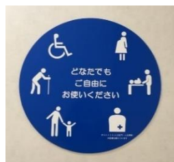
多目的トイレピクトサイン (旧サインは撤去)