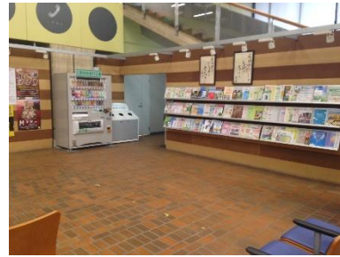
新設予定場所(掲示板の見える場所)