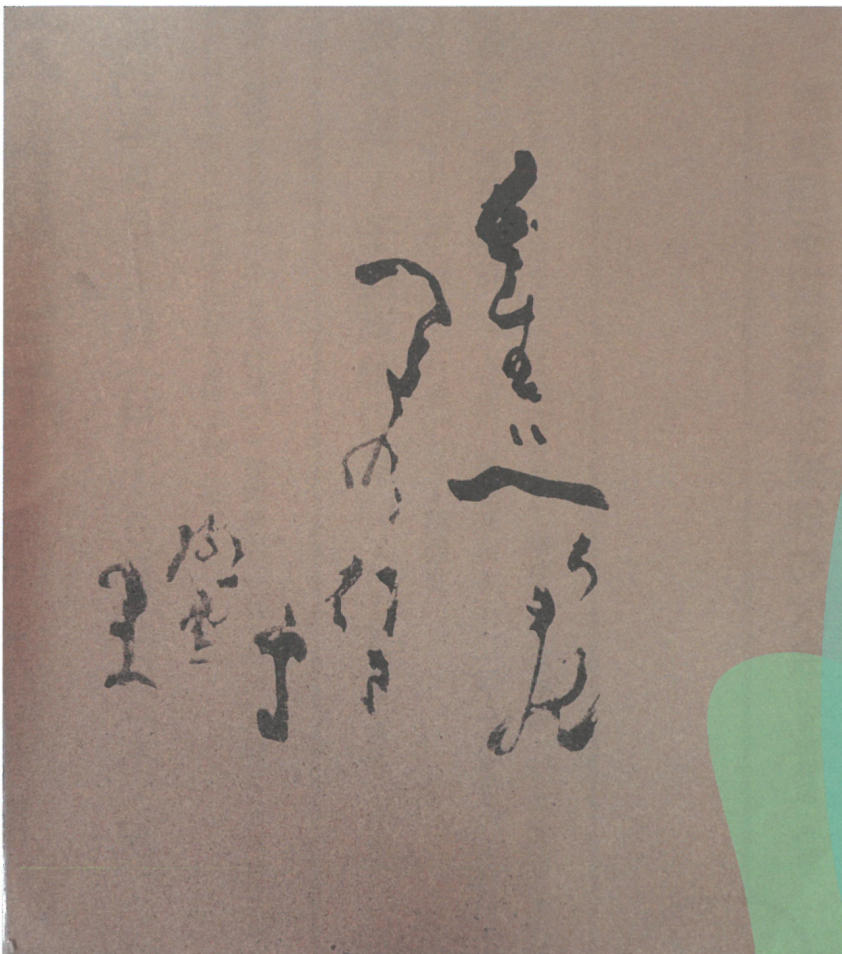
極堂句複製「吾生へちまのつるの行き処」

○俳句塾 9月17日(土) 13時～17時 愛媛大学教育学部准教授 青木亮人先生 講話「吟行と『写生』について」 ○吟行会 9月18日(日) 10時～16時 1階視聴覚室および道後界限