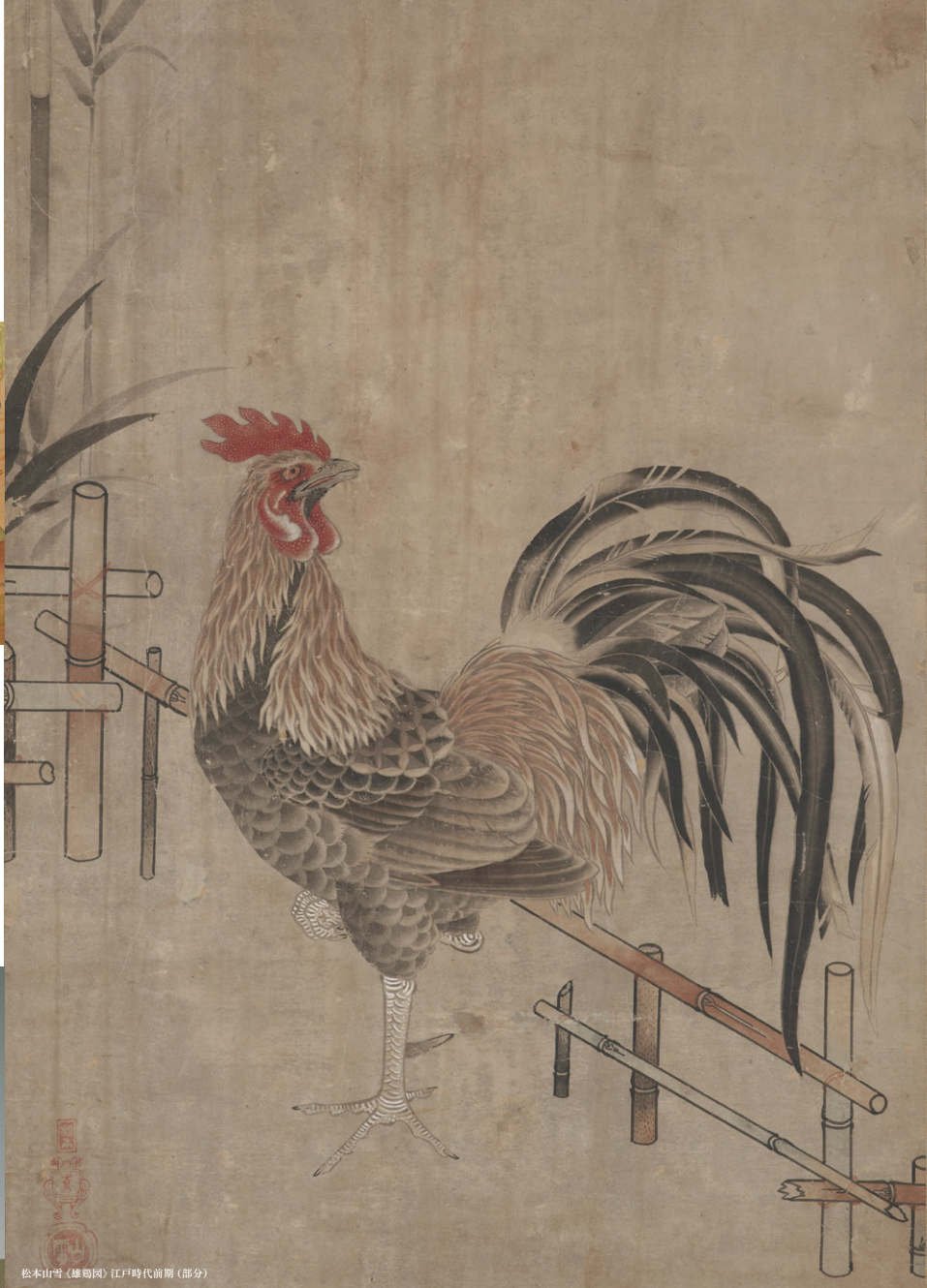
松本山雪(雄鶏図)江戸時代前期(部分)