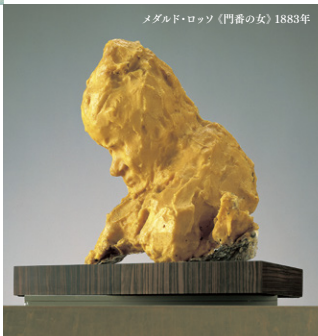
メダルド・ロッセ(門番の女)1883年