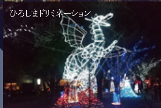
プラチナドラゴン