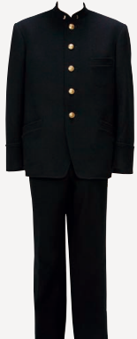
帝国大学学生服(複製)《株式会社トンボ所蔵》