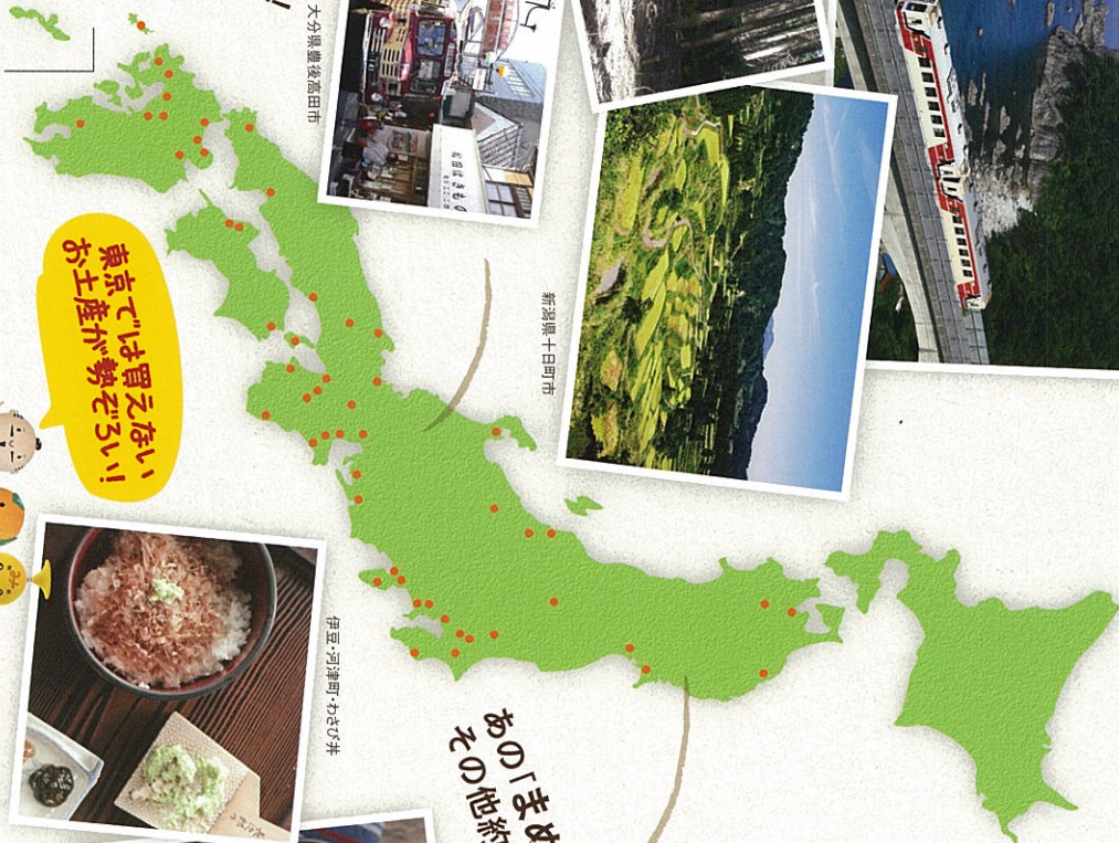
大分県豊後高田市