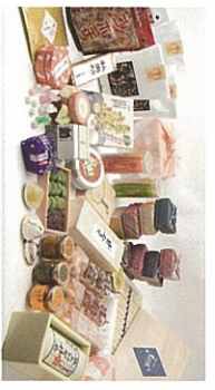
全国の特産品が勢ぞろい!購入者にはおまけに ラシヤ(抽選)も! ※画面イメージです