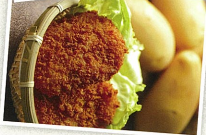
静岡県三島市・みしまコロッケ