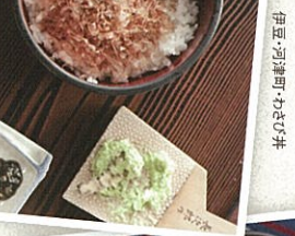
伊豆・河津町・わさび丼