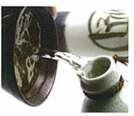
全国の産地が集結! 利き酒も楽しめる!