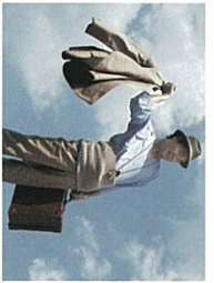
電器のまな会さん/バネ山屋 「男はつらいよ」パネル展

無料で楽しめる『男はつらいよ』パネル展、ご当地キヤラ記念撮影会、ロケ地情報誌 「ロケーションジヤパン」がオンスズするロケ地マツプコーナーのほか、全国の日本酒・ お土産(グルメ)のお買いものも充実!