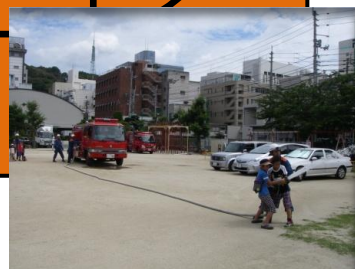
《消防ホース延長訓練（児童）》