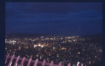
松山城からの夜景