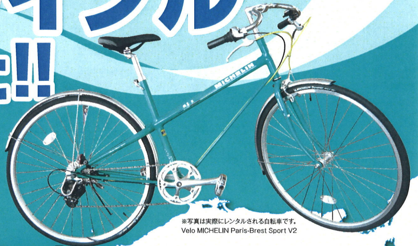
※写真は実際にレンタルされる自転車です。 Velo MICHELIN Paris-Brest Sport V2