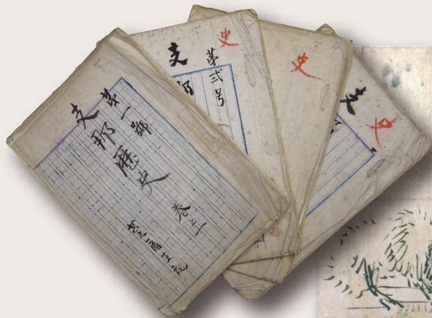
左/正岡子規筆 講義ノート(法政大学図書館所蔵)

1883(明治16)年に上京した子規・真之は、共立学校などの学校で勉学に励み、東京大学予備門に入學します。東京には、全国から優秀な若者たちが集まり、彼らは、勉強だけでなく、寄席などの娯楽や野球のような新しいスポーツに触れ、近代的な東京の文化を満喫しました。彼らは書生とよばれ、その熱気あふれる活動は、独特な文化を生み出します。 今回の展示では、子規・真之の青春時代の教育や生活、人びととの交流をみていくなかで、書生とよばれた明治の若者たちの実像に迫ります。