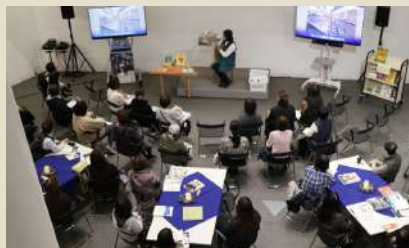
南海放送アナウンサーによる読み聞かせ 19:00～19:20