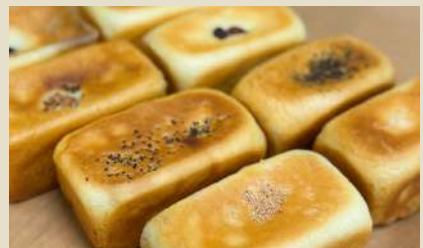
「小さな幸せ」ミニ生食パン販売 18:30～20:00