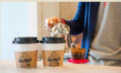
「本の轍」ドリップコーヒー販売 18:30～20:00