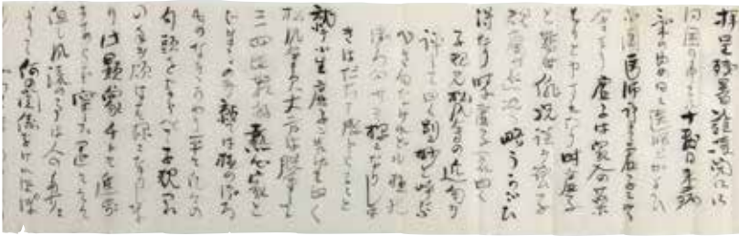
柳原極堂の子規あて書簡（明治29年8月27日）