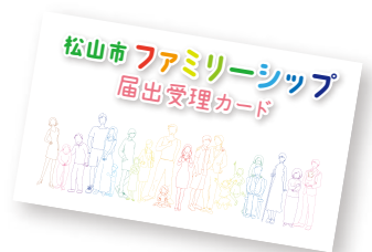
ファミリーシップ届出受理カード

また、この制度を利用していることについては、本人の同意なく口外しないでください。