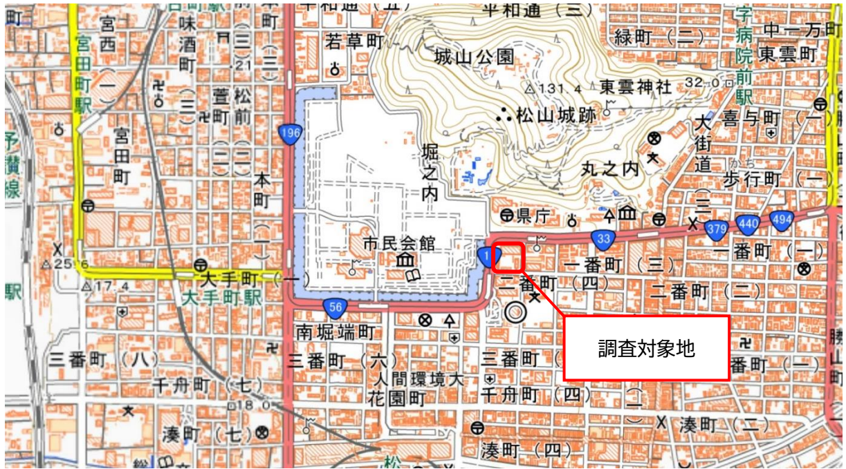
(地理院地図を加工して作成)