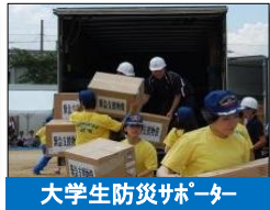
大学生防災サポーター