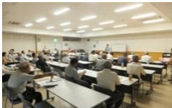
高齢者防火防災セミナー