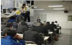
防火・防災管理講習