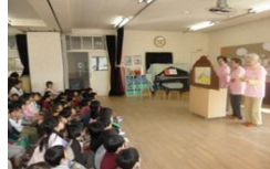
防災かみしばい(幼年)