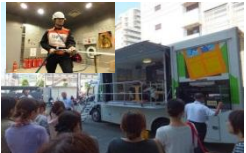
地震体験・消火訓練