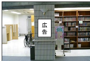
②1階書庫横掲出場所