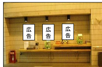
③1階ロビー公衆電話前掲出場所(3枠)