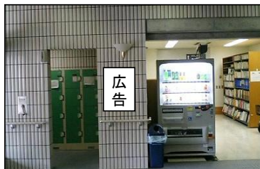
①1階自動販売機横掲出場所