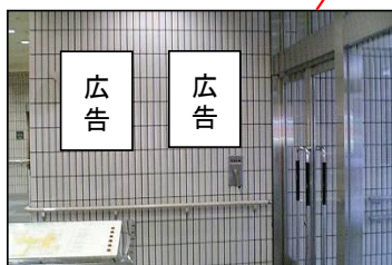
④1階玄関横掲出場所(2枠)