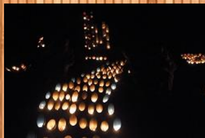
ホタル観賞会の竹灯籠