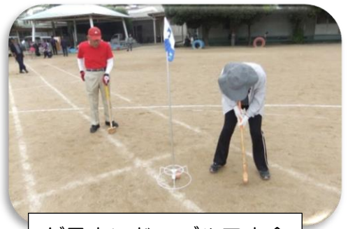
グラウンド・ゴルフ大会