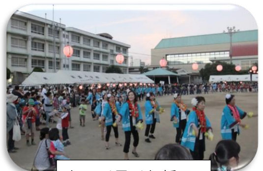
トワイライト新玉