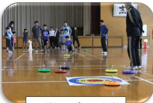
こどもスポーツ大会